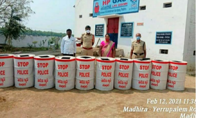
Feb 12, 2021 11:36 Madhira - Yerrupalem Rd Madhira