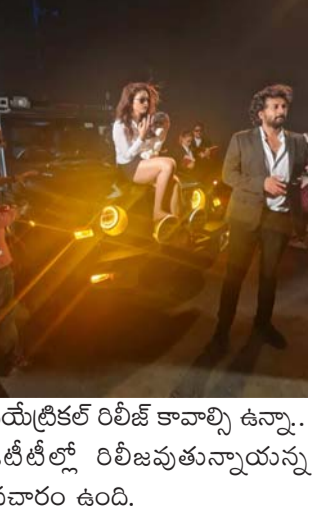
ఢియేట్రికల్ రిలిజ్ కావాలి ఉన్నా.. ఓటీటీలో రిలీజవుతున్నారన్న ప్రచారం ఉంది.