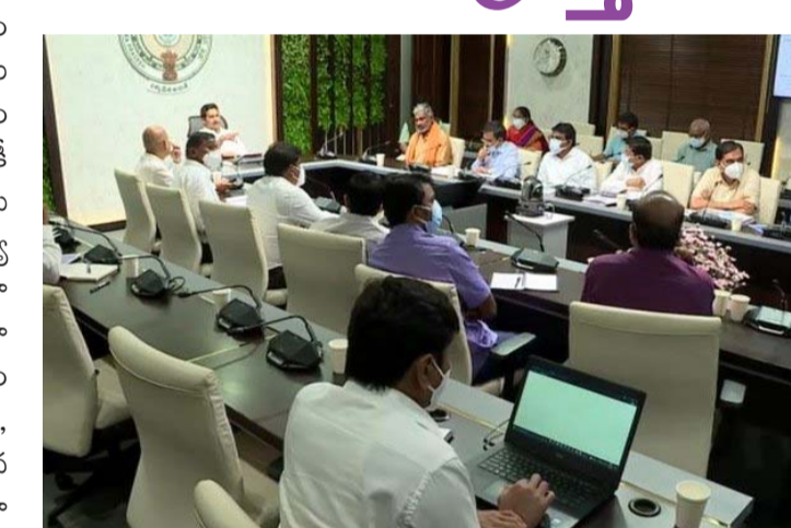
అమరావతి, జులై 13, ప్రజాపాలన ప్రతినిధి: గ్రామ సచివాలయాలు, విలేజ్ క్లినిక్స్, డిజిటల్ లైబ్రరీలు అన్నీకూడా ఈ ఏడాదే పూర్తి చేయాలని ముఖ్యమంత్రి వైఎస్ జగన్మోహన్రెడ్డి ఆధికారులను ఆదేశించారు. జియో

ట్యూగింగ్ చేసి నిర్మాణాల తీరుపై సమీక్ష చేయాలని తెలిపారు. పంచాయతీరాజ్ గ్రామీణాభివృద్ధి శాఖల్లో పలు కార్యక్రమాలపై మంగళవారం ఠాడేవల్లోని తన క్యాంపు కార్యాలయంలో సీఎం జగన్ సమీక్ష నిర్వహించారు. ఈ సందర్భంగా ఆయన మాట్లాడుతూ.. వైఎస్సార్ జగన్నన్న కాలనీల్లో మౌలిక సదుపాయాల కల్పనకు సంబంధించి ప్రాధాన్యతను పనులు చేపట్టాలన్నారు. పల్లెలను పరిశుభ్రంగా ఉంచే కార్యక్రమానికి పెద్ద పీట వేయాలని ఆధికారులకు జగన్ సూచించారు. (మిగతా 2లో..)