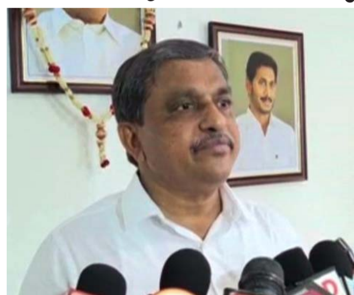
అమరావతి: బీసీల ఆత్మగౌరవం నిలబెట్టిన నాయకుడు సీఎం జగన్ అని, బలహీనవర్గాల ఎదుగుదల కోసం ఆయన కృషి చేస్తున్నారని ప్రభుత్వ

సలహాదారు సజ్జల రామకృష్ణారెడ్డి తెలిపారు. ఆయన మంగళవారం మీడియాతో మాట్లాడుతూ.. సీఎం జగన్ సంక్షేమ పాలనను చూసి కొంతమంది ఓర్వలేకపోతున్నారని అన్నారు. దుష్ప్రచారాలను మనందరం కలిసి తిప్పి కొట్టాలన్నారు. దేశంలోనే ఎన్నడూ లేనివిధంగా బీసీల ఆత్మగౌరవం నిలబెట్టిన నాయకుడు సీఎం జగన్ అని గుర్తుచేశారు. గత నాయకులు బలహీనవర్గాలను ఓటబాంతుగా చూస్తే, బలహీనవర్గాల ఎదుగుదల కోసం సీఎం జగన్ కృషి చేస్తున్నారని తెలిపారు. సంప్రదాయ బద్ధమైన రాజకీయాలు చేసి లబ్ధి కోసం కాకుండా భావిచరణ భవిష్యత్తు కోసం చూసే నాయకుడు సీఎం జగన్ అన్నారు. కొంతమంది చేయలేని పనులను ముఖ్యమంత్రి జగన్ చేస్తుంటే రాజకీయ శూన్యంతో ఆరోపణలు చేస్తూ, పిచ్చిరాతలు రాస్తున్నారని మండిపడ్డారు. ఇలాంటి దుష్ప్రచారాలను మనమంతా కలిసి తిప్పి కొట్టాలన్నారు. బీసీల్లోని 139 కులాలకు గొప్ప అవకాశం కల్పించారని గుర్తుచేశారు. ఈ అవకాశం ఉపయోగించుకొని సామజికంగా, రాజకీయంగా ఎదుగాలన్నారు. బీసీ కార్పొరేషన్ల వైర్యం, డైరెక్టర్ల.. వచ్చిన అవకాశాన్ని సద్వినియోగం చేసుకొని సీఎం జగన్ ఆకాంక్షకు అనుగుణంగా పనిచేయాలని కోరుకుంటున్నారని సజ్జల తెలిపారు.