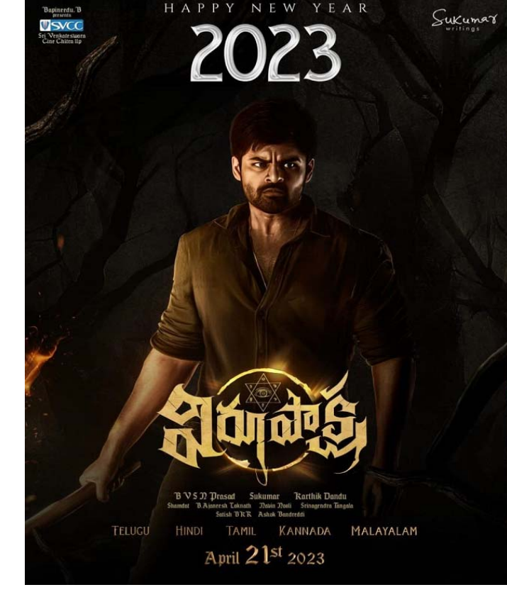
మోగా మేనల్లుడు సాయిశేజ్ లైన్ లోకి వచ్చేసిన సంగతి తెలిసింది. కొత్త సినిమాల విషయంలో మూసధోరిణి పదిలనట్టే కనిపిస్తుంది. పాత పద్ధతికి

స్వస్తి పలికి ట్రెండింగ్ హిట్ కాన్సాట్స్ ల వైపు అడుగులు వేస్తున్నాడు. ఇటీవలే కార్తిక్ దండుతో కూడా కొత్త సినిమా విరూపాక్ష లాంచ్ చేసిన సంగతి తెలిసిందే. ఇదొక మిస్టికల్ డ్రీల్స్ నేపథ్యంలో తెరకెక్కిస్తున్నారు. ఇప్పటికే రిలీజ్ అయిన చిన్న టీజర్ గ్లింప్స్ తోనే సినిమాపై అంచనాలు అంతకంతకు పెంచేసారు. గ్లింప్స్ ఆద్యంతం ఆకట్టుకుంటుంది. సస్పెన్స్ ఇంటెన్స్ డ్రీల్స్ అని గ్లింప్స్ తోనే క్లారిటీ వచ్చేసింది. అజ్ఞానం భయానికి మూలం.. భయం మూఢ నమ్మకానికి కారణం. ఆనమ్మకమే నిజమైనప్పుడు.. ఆ నిజం జ్ఞానానికి అంతు చిక్కనప్పుడు అసలు నిజాన్ని చూపించే మరో నేత్రం విరూపాక్ష అంటూ గ్లింప్స్ ఎస్టిఆర్ వాయిస్ ఓవర్ తో ఆద్యంతం ఆసక్తిని రేకెత్తించింది. నెట్ పూల్ సన్నివేశాలు ఇంటెన్స్ మోడీ లోకి తీసుకెళ్లాయి. సాయిశేజ్ న్యూ లుక్ కొత్త ఫ్రెష్ ఫీల్ ని తీసుకొచ్చింది. తాజాగా నూతన సంవత్సరాన్ని పురస్కరించుకుని మరో కొత్త పోస్టర్ రిలీజ్ చేసారు. యాక్షన్ పోస్టర్ ఆద్యంతం ఆకట్టుకుంటుంది. మిస్టరీని ఛేదించే క్రమంలో ఎదురైన సవాళ్లను ఎలా అధిగమిస్తున్నాడు? అన్నది పోస్టర్లో రివీల్ చేసారు. బ్యాక్ గ్రౌండ్లో వాతావరణం అంతా భయానకంగా కనిపిస్తుంది. కాలుతోన్న చెట్లు.. విరూపాక్ష చేతిలో బలమైన కర్ర. తీక్షణమైన చూపు పరిశీలిస్తే బలమైన శక్తులతోనే పోరాటం చేస్తున్నట్లు తెలుస్తుంది. మొత్తానికి విరూపాక్ష ఒక్కో అప్ డేట్ సినిమాకి మంచి హైప్ ని తీసుకొస్తుంది. టీజర్.. ట్రైలర్ రిలీజ్ తో మరింత బజ్ క్రియేట్ అవుతుంది. పాన్ ఇండియా ప్రాజెక్ట్ గా ప్రేక్షకుల ముందుకు తీసుకొస్తామన్నారు. తెలుగు.. హిందీ.. తమిళ్.. కన్నడ.. మలయాళ భాషల్లో ఏప్రిల్ 21 రిలీజ్ అవుతుంది. ఈచిత్రాన్ని టీ.వీ.ఎస్ .ఎస్ ప్రసాద్ నిర్మిస్తున్నారు.