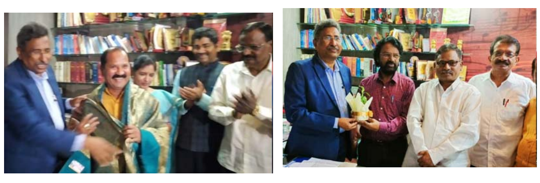
హైదరాబాద్ (ప్రజాపాలన ప్రతినిధి) : బహుజన రాజ్యాధికారమే ఏకైక లక్ష్యంగా ముందుకు దూసుకెళ్తున్న పూలే ఆంబేద్కర్ రాజ్యాధికార నమితి(పార్టీ) ఏప్రిల్ 14 వరకు పదిలక్షల మంది సభ్యుల (మిగతా 2లో..)