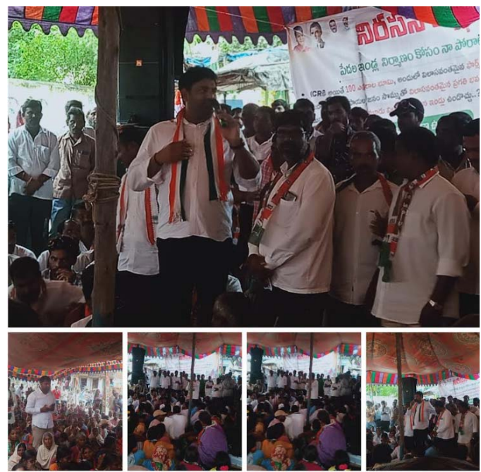
పార్టీ కీలకమైన పాత్ర పోషించింది అని అన్నారు.తల్లి సోనియాగాంధీ తెలంగాణ రాష్ట్ర ఏర్పాటు కోసం ప్రత్యేక శ్రద్ధ తీసుకున్నారు అని అన్నారు.ఆంధ్రాపాలకుల విముక్తి కోసం పోరాటం చేసి