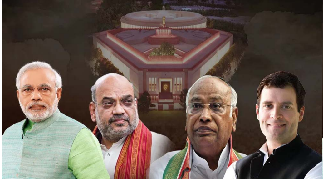
2014, 2019 లోక్‌సభ ఎన్నికల్లో దారుణ ఫలితాల తర్వాత 2024 ఎన్నికల్లో చావో రేవో తేలుకునేందుకు కాంగ్రెస్ పార్టీ నన్నద్దమవుతోంది. బీజేపీని వ్యతిరేకించే పార్టీలన్నింటినీ ఒక్కతాటిపైకి తేవడానికి యధాశక్తి ప్రయత్నిస్తోంది. అవసరమైతే ఓ మెట్టు దిగుతోంది. ఆమ్ ఆద్మీ పార్టీ

విషయంలో వట్టువిడంపులు ప్రదర్శించిన కాంగ్రెస్ నేతల ధోరణి దీనినే చాటుతోంది. పాట్నూలో జరిగిన సమావేశంలో ధీల్లీ ఆర్డినెన్సుకు కాంగ్రెస్ పార్టీ మద్దతు ఇవ్వకపోవడంతో కిసుక వహించి, వివక్షల మలి భేటీ బెంగళూరు సమావేశానికి గైర్జాబరయ్యే సంకేతాలు కేజ్రీవాలి పార్టీ వైపు నుంచి రావడంతో కాంగ్రెస్ అధిష్టానం ఓ మెట్టు దిగి వచ్చి మరీ సయోధ్య చేసుకుంది. బెంగళూరు పార్టీ సారథ్యంలో బీజేపీయేతర వివక్షలు సమావేశం కాబోతున్నాయి. అయితే తొలి రోజు భేటీకి, విందుకు బెంగాల్ దీదీ మమతా బెనర్జీ రాకపోవడం వెనుక మత లభోంటన్నది వద్దం చర్చనీయాంశంగా మారింది. అనారోగ్యం కారణంగా తొలి రోజు భేటీకి రావడం లేదని దీదీ చెప్పుకోవచ్చు గాక.. రెండో రోజు భేటీకి వచ్చే ఓపిక వున్నప్పుడు తొలి రోజు ఎందుకు గైర్జాబరయ్యే న్నారన్నది ఆసక్తి రేపుతోంది. మొత్తమ్మీద బెంగళూరు భేటీ తర్వాత వివక్షల కూటమికి ఓ పెద్ద ఏర్పడే అవకాశం కనిపిస్తోంది. బీజేపీ జాతీయతా వాదాన్ని ధీటుగా ఎదుర్కొనేందుకు తమ కూటమి పేరులో 'జాతీయ' అనే పదం వుండేలా చూసుకుంటున్నాయి బీజేపీయేతర వివక్ష పార్టీలు. భారతీయ జనతా పార్టీ ఎన్డీయే అవసరాన్ని కాస్త లేటుగానే గుర్తించింది. (మిగతా 2లో..)