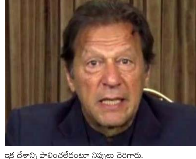
ఇక దేశాన్ని పాలించలేదంటూ నిప్పులు చెరిగారు.

ఇస్లామాబాద్: పాకిస్తాన్ ప్రధాని ఇప్రూన్ ఖాన్ పై జమాతే ఇస్లామీ (జేఐ) చీఫ్ సిరాజుల్-హక్ తీవ్ర వ్యాఖ్యలు చేశారు. ఇప్రూన్ ను 'అంతర్జాతీయ బిచ్చగాడు' అని అభివర్ణించారు. దేశం ఎదుర్కొంటున్న ఆర్థిక సంక్షోభంతోపాటు అన్ని సమస్యలకు ఆయనే కారణమని ఆరోపించారు. ఆయనను సాగనంపితే తప్ప సమస్యలు పరిష్కారం కావన్నారు. స్థానిక సంస్థల ఎన్నికల నేపథ్యంలో లాహోర్ లో జరిగిన సభలో ఆయన మాట్లాడుతూ.. దేశంలో మళ్లీ ఎన్నికలు నిర్వహించాలని డిమాండ్ చేశారు. ఇప్రూన్ ఖాన్ ప్రభుత్వం పెట్రో ధరలను దారుణంగా పెంచేసిందని మండిపడ్డారు. ఇప్రూన్, పాకిస్తాన్ రెండూ కలిసి పనిచేయడం సాధ్యం కారన్నారు. దేశ రాజకీయాల్లో కూడికలు, తీసివేతలకు చోటు లేదని, ఇప్రూన్ నిప్పుమణి ఒక్కటే అన్ని సమస్యలకు చక్కని పరిష్కారమని అన్నారు. రుణాల కోసం అంతర్జాతీయ ద్రవ్యనిధి (ఐఎంఎఫ్) చుట్టూ పాకిస్తాన్ చక్కర్లు కొడుతుండడంపై సిరాజుల్ మాట్లాడుతూ.. ఇప్రూన్ ఓ అంతర్జాతీయ బిచ్చగాడని ఆగ్రహం వ్యక్తం చేశారు. పీఠీయ సారథ్యంలోని పాక్ ప్రభుత్వం