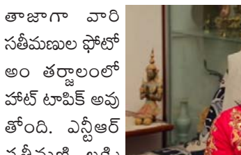
తాజాగా వారి సతీమణులు ఫోటో అం తర్రాలంలో హాట్ టాపిక్ అవుతోంది. ఎన్టీఆర్ సతీమణి లక్ష్మి ప్రణయి.. కళ్యాణ్ రామ్ సతీమణి స్వాతి ఇరువురు ఓ ఫోటోలో కనిపిస్తున్నారు. తోటి కోడళ్లు ప్రణయి తారక్ - స్వాతి కళ్యాణ్ రామ్ అనుబంధంపై అభిమానులు అబ్బురపడిపోతున్నారు. ఆ ఇద్దరూ అక్కా చెల్లెళ్లలానే ఉన్నారని నందమూరి అభిమానులు వ్యాఖ్యానిస్తున్నారు. ప్రస్తుతం ఈ ఫోటో అంతర్జాలంలో వైరల్ గా మారింది. తారక్ ప్రస్తుతం

యంగ్ బైగర్ ఎన్టీఆర్ కథానాయికుడిగా నటించే సినిమాలన్నిటికీ కళ్యాణ్ రామ్ ఒక నిర్మాతగా కొనసాగుతున్నారు. ఎన్టీఆర్ ఆర్ట్ బ్యానర్ ఇతర బ్యానర్లతో కలిసి తారక్ తో సినిమాల్ని నిర్మించడం రివాజుగా మారింది. ఇది సోదరుల మధ్య ఘాదమైన అనుబంధాన్ని గుర్తు చేస్తోంది. అన్న కళ్యాణ్ రామ్ అంటే తమ్ముడు ఎన్టీఆర్ కి ప్రాణం. సోదరుడు ఎన్టీఆర్ అంటే కళ్యాణ్ రామ్ ఎంతో ఎమోషనల్ గా ఉంటారు. ఇకపోతే ఎన్టీఆర్ - కళ్యాణ్ రామ్ కుటుంబాల నడుమ చక్కని అనుబంధానికి సింబాలిక్ గా