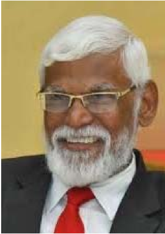
రాజ్యాంగ మౌలిక లక్ష్యాలు వర్తమాన కర్తవ్యాలు

15.1. దేశాభివృద్ధికి భారత రాజ్యాంగ మౌలిక లక్ష్యాలు, వర్తమాన కర్తవ్యాలు ముఖ్యం. సమస్త వర్ణ, వర్ణ, కుల, లింగ, జాతి, మత, ప్రాంత విచక్షణలను, అసమానతలను తొలగిస్తూ, స్వేచ్ఛా, సమానత్వం, సౌభ్రాతృత్వం, ఆత్మగౌరవం, సంపదసృష్టి, సమాన పంపిణీ, సమాన అవకాశాలు అందే ఏర్పాటు శాంతియుతంగా సమాజం అభివృద్ధి పథంలో ముందుకు సాగడం భారత రాజ్యాంగ మౌలిక లక్ష్యాలు, వర్తమాన కర్తవ్యాలు. భారత రాజ్యాంగంలోని 5వ ఆర్టికల్ నుండి 19వ ఆర్టికల్ వరకు 29, 37, 46, 368, 340 ఆర్టికల్స్ ఈ లక్ష్యాలను సృష్టించేస్తాయి. బీసీ, ఎస్సీ, ఎస్టీల విషయానికి వస్తే 15, 16 ఆర్టికల్స్ చాలా ముఖ్యమైనవి. ఈ ఆర్టికల్స్ అనుసరించి ఏమేరకు అభివృద్ధి, సంక్షేమ ఉద్యోగ అవకాశాలు అందుకుంటారు ఆ మేరకే నిజంగా స్వాతంత్ర్య ఫలాల అందినట్లు.