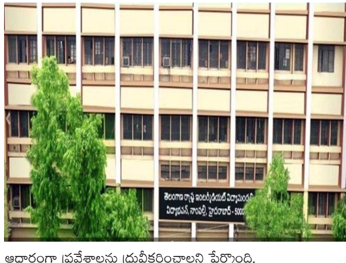
ఆధారంగా ప్రవేశాలను ప్రవేశపెట్టాలని పేర్కొంది.

హైదరాబాద్, మే 25 (ప్రజాపాలన ప్రతినీధి) : ఇంటర్నెటియట్ ప్రవేశాలకు షెడ్యూల్ విడుదలైంది. నేటి నుంచి జులై 5వ తేదీ వరకు ప్రవేశాలకు అనుమతి. జూన్ 1 నుంచి ఇంటర్ మొదటి సంవత్సరం ఆన్ లైన్ తరగతులు ప్రారంభం కానున్నాయి. ఇంటర్నెట్ మార్కుల మెమోల ఆధారంగా ప్రాథమిక ప్రవేశాలు చేసుకోవాల్సిందిగా కళాశాలల డిప్యూటీ ఇంటర్ బోర్డు సూచించింది. అనంతరం ఎన్ ఎస్ సి పాస్ సర్టిఫికేట్, డీసీ, స్టడీ సర్టిఫికేట్