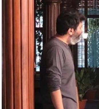
పాస్ ఇండియన్ స్టాయిల్ షాన్ చేస్తున్నట్టుగా ఊహాగానాలు వినిపిస్తున్నాయి. అయితే డీనిపై ఇంకా అధికారిక ప్రకటన రాలేదు కానీ టాక్ అయితే నడుస్తోంది. నిజానికి టాలీవుడ్ స్టార్ హీరోలందరూ ఇప్పుడు పరుసగా పాస్ ఇండియా మూవీస్ తో బిజీగా ఉన్నారు. అయితే ఒక్క మహేష్

సూపర్ స్టార్ మహేష్ బాబు - దర్శకుడు త్రివిక్రమ్ శ్రీనివాస్ కాంబినేషన్ కు వుండే క్రేజ్ గురించి ప్రత్యేకంగా చెప్పక్కర్లేదు. వీరి కలయికలో వచ్చిన 'అతడు' 'ఖలేజా' సినిమాలు క్లాసిక్స్ నిలిచిపోయాయి. ఈ క్రమంలో 11 ఏళ్ల తర్వాత క్రేజ్ కాంబోలో హ్యాటిక్ మావీకి అధికారిక ప్రకటన వచ్చిన విషయం తెలిసిందే. మహేష్ కెరీర్ లో 28వ చిత్రాన్ని త్రివిక్రమ్ డైరెక్ట్ చేస్తుండటంతో అభిమానుల ఆసందానికి అవధులు లేకుండా పోయాయి. అయితే 'ఎస్ఎస్ఎంబీ28' ప్రాజెక్ట్ గురించి డైలీ ఏదోక వార్త వస్తూనే ఉంది. లేటెస్టుగా మరో క్రేజ్ బజ్ ఈ సినిమాపై వినిపిస్తోంది. అదేంటంటే 'ఎస్ఎస్ఎంబీ28' చిత్రాన్ని