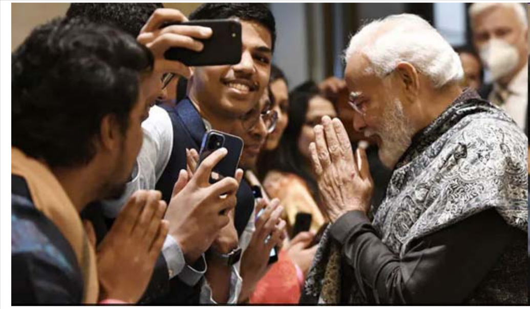
బెర్లిన్: ప్రవాస భారతీయులను ఉద్దేశించి దాదాపు గంటపాటు కొనసాగిన ప్రధాని మోడీ ప్రసంగంలో 'భారత్ మాతాకీ జై', '2024 ని నాదం ఎక్కడ'గా వినిపించింది. దీంతో వచ్చే 2024 సాధారణ ఎన్నికల్లో బీజేపీ ప్రధాన ప్రచార నినాదం 'వన్స్ మోడీ ఇన్ 2024' కాబోతోందా అని

విజయవాడ నగరంలో రాఘవయ్య పార్క్ వద్ద గల మన ఆఫీస్ లో స్నేహ గ్రూప్ సభ్యులకు సమావేశాలు నిర్వహించుకునేందుకు 40 మంది వరకు అవకాశం కల్పించబడును వివరాలకు ఈ క్రింది నెంబర్లలో సంప్రదించగలరు 9000621111, 9440137451