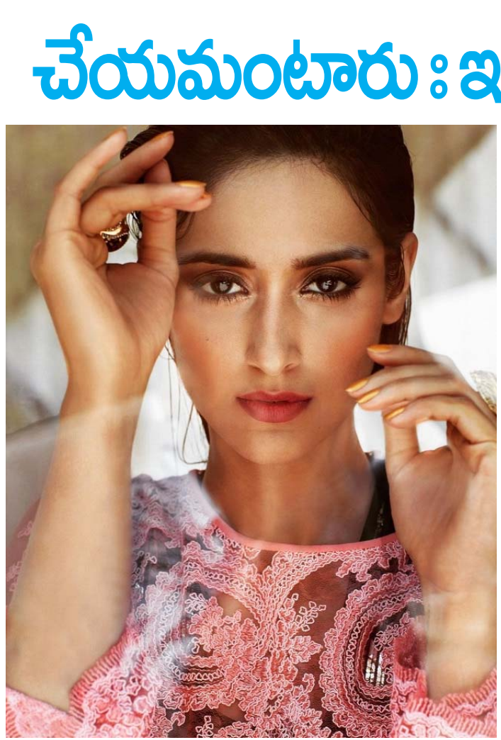
ఇలియానా అంటే అందం.. అందం అంటే ఇలియానా అన్నట్లుగా ఉండేది టాలీవుడ్. ఈ నడుము సుందరి జమానా అలా సాగిపో