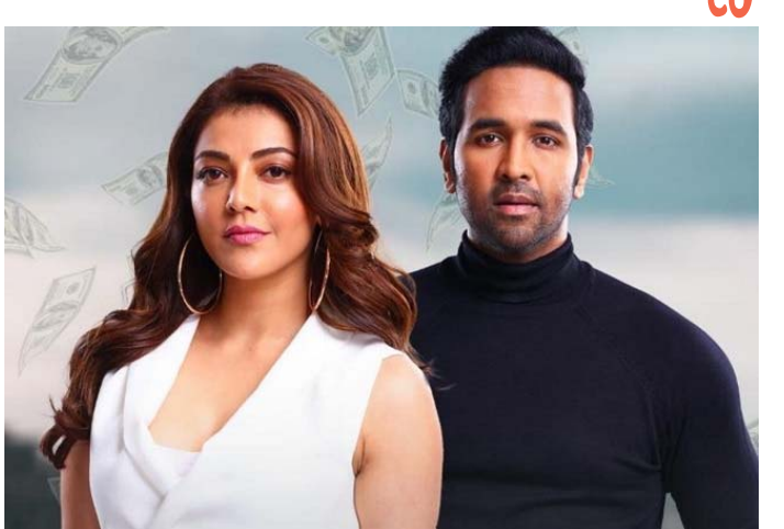
దాదాపు రూ.50 కోట్ల బడ్జెట్ తో ఈ సినీమాను తెరకెక్కిస్తున్నారు. ఈ చిత్రంలో బాలీవుడ్ స్టార్ సునీల్ శెట్టితోపాటు నవదీప్ నవీన్ చంద్ర ముఖ్యపాత్రల్లో కనిపించనున్నారు. తద్వారా వివీఎంబీ టైమ్స్ లో 24 ఫ్రేమ్స్ ఫ్యాక్షరీ బ్యానర్లపై విష్ణు స్వయంగా రప్పించేందుకు ప్లాన్ చేస్తున్నారు.

చెప్పిందట ప్రీతి. తన ఫ్యామిలీ మొత్తం అమెరికాలో ఉంటోందని ఇలాంటి సినీమాలో నటిస్తే బాగుండదని చెప్పిందట. దీంతో.. కాజల్ ను అప్రోచ్ అయినట్టు వెల్లడించారు విష్ణు. అయితే.. స్టార్ హీరోయిన్ గా ఉన్నప్పటికీ సిస్టర్ పాత్రలో నటించడానికి కాజల్ వెంటనే ఒప్పుకుందని చెప్పారు విష్ణు. కాగా.. ఈ విషయమై పలువురు హీరోలు ఆటపటిస్తూన్నారని చెప్పారు మంచు హీరో. మా సినీమాల్లోని హీరోయిన్ ను సిస్టర్ గా మార్చేశావా? అని ఘనీగా అడుగుతున్నారని చెప్పాడు. కాగా.. ఈ విషయమై పలువురు హీరోలు ఆటపటిస్తూన్నారని చెప్పారు మంచు హీరో. మా సినీమాల్లోని హీరోయిన్ ను సిస్టర్ గా మార్చేశావా? అని ఘనీగా అడుగుతున్నారని చెప్పాడు. అయితే.. ఈ సినీమాలో కాజల్ పాత్ర తన క్యారెక్టర్ కన్నా చాలా కీలమైందని తెలిపాడు విష్ణు.