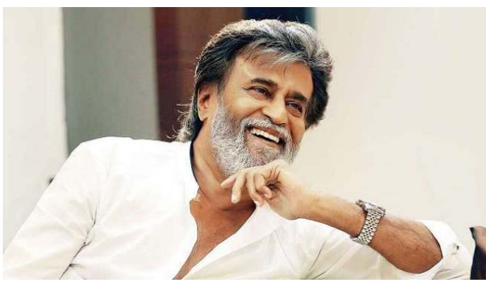
ఫోన్ చేసిన రజనీ.. మాటింగ్ స్టార్ట్ త్వరలోనే సెట్స్ లో అడుగు పెడుతు చేయాలని సూచించాడట. దీంతో.. నాడట తల్లివా. అంతేకాదు.. ఇకపై