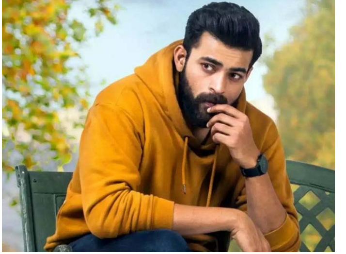
మెగా హీరో వరుణ్ తేజ్ ప్రస్తుతం ఎఫ్ 3 మరియు గని సినీమాలతో ప్రేక్షకుల ముందుకు వచ్చేందుకు సిద్ధం అవుతున్నాడు. ఒక వైపు ఈ రెండు సినీమాలు చేస్తూనే మరో వైపు కొత్త సినీమాలు కూడా కమిట్ అవుతున్నారు. సినీ వర్గాల నుండి అందుతున్న సమాచారం ప్రకారం గత ఏడాది భీష్మ సినీమా తో సూపర్ హిట్ ను దక్కించుకున్న వెంకీ కుడుముల దర్శకత్వంలో వరుణ్ తేజ్ సినీమా చేయబోతున్నాడట. ఇప్పటికే స్క్రిప్ట్ రెడీ చేసిన దర్శకుడు వెంకీ కుడుముల త్వరలోనే వరుణ్ తేజ్ తో సినీమా మొదలు పెట్టబోతున్నట్లుగా టాక్ వినిపిస్తుంది. ఫలో మరియు భీష్మ సినీమాలతో నక్సెన్ ఫుల్ దర్శకుడిగా పేరు దక్కించుకున్న వెంకీ కుడుముల మరో నక్సెన్ ను వరుణ్ తేజ్ తో దక్కించుకుంటాడా అనేది చూడాలి. గత ఏడాది వెంకీ కుడుముల మెగా స్టార్ చిరంజీవికి కథ వినిపించాడనే వార్తలు వచ్చాయి. కాని చిరు కాకుండా వరుణ్ తేజ్ తో సినీమా పైసల్ అయ్యిందని అంటున్నారు. ఇటీవల మహేష్ బాబుతో కూడా వెంకీ కుడుముల సినీమా అంటూ ప్రచారం జరిగింది. కాని చివరకు వెంకీ కుడుముల కొత్త సినీమాను మెగా హీరో వరుణ్ తేజ్ తో చేసేందుకు సిద్ధం అవుతున్నాడని అంటున్నారు. పూర్తి వివరాలు త్వరలో వెళ్లడయ్యే అవకాశం ఉంది.

మీడియాలో ట్రోల్ చేస్తున్నారని కొందరు. తాజాగా.. నేషనల్ మీడియాకు ఇచ్చిన ఇంటర్వ్యూలో ఈ విషయమై ఫైర్ అయ్యింది గోవా బ్యూటీ. తనలో బ్యూటీ స్పాట్స్ కూడా ఉన్నాయని వాటిని కాకుం డా లోపాలను మాత్రమే ఎత్తిచూ వడం సరికాదని చెబుతోంది. అంతేకాదు.. తన బాడీ పార్ట్ లో కొన్ని భాగాలు తనకు కూడా నచ్చవని చెప్పడం విశేషం. ఎదభా గంతోపాటు చేతులు సన్నగా ఉ ంటాయని ముక్కు పెదాలు కూడా సరిగా ఉండవని చెప్పింది ఇలియా నా. అంతేకాకుండా.. తాను చూడడానికి అంత పొడవుగా కనిపిం చనని నల్లగా కూడా ఉంటానని చెప్పకొచ్చింది భామ. ఈ విషయాల ను తనను వేధిస్తుంటాయని చెప్ప దం ద్వారా.. తనలోని ఇన్ఫీరి యారిటీ కాంప్లెక్స్ ను బయట పెట్టింది గోవా సుందరి. ఎవరైనా తన బాడీ సైజ్ గురించి చెప్పమంటే ఇబ్బంది వదతానని కూడా చెప్పింది.