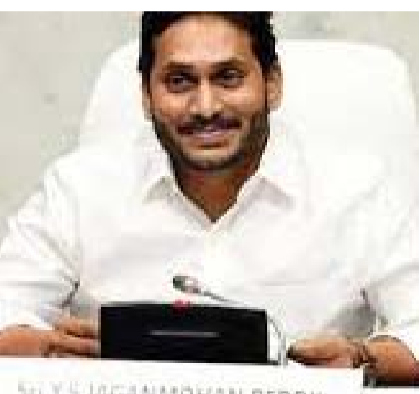
SHYAM JAGANMOHAN REDDY

తాడేపల్లి: వైఎస్సార్ కాంగ్రెస్ పార్టీ 12 వసంతాలు పూర్తి చేసుకుని ఆదివారం 13వ సంవత్సరంలోకి అడుగు పెట్టింది. రాష్ట్ర వ్యాప్తంగా అన్ని నియోజకవర్గాల్లో పార్టీ ఆవిర్భావ వేడుకలను నేతలు, కార్యకర్తలు ఘనంగా నిర్వహిస్తున్నారు. ఈ సందర్భంగా వైఎస్సార్ సీపీ అభిమానులకు, కార్యకర్తలకు, నాయకులకు, రాష్ట్ర ప్రజలందరికీ ముఖ్యమంత్రి వైఎస్ జగన్మోహన్ రెడ్డి శుభాకాంక్షలు తెలిపారు. పార్టీ ఆవిర్భావ దినోత్సవంపై సీఎం జగన్ ట్వీట్ చేశారు. 'గత 12 ఏళ్లుగా నా ఈ ప్రయాణంలో నాతో నిలబడి, నాకు వెన్నుదన్నుగా ఉన్న ప్రతి ఒక్కరికీ కృతజ్ఞతలు. మన పార్టీ జెండాను తమ గుండెగా మార్చుకున్న నా కార్యకర్తలకు పేరు పేరునా కృతజ్ఞతలు. మన ప్రయాణం ఎప్పటికీ ఇలాగే కొనసాగుతూ ఉండాలని కోరుకుంటున్నాను' అంటూ సీఎం జగన్ ట్వీట్ చేశారు.