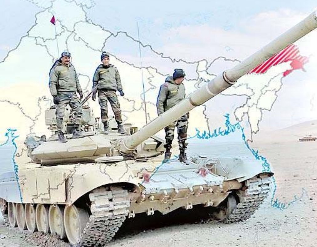
వరిజ్ఞానాలు, పూర్వోత్పక అణ్ణాయుధాల విషయంలో అమెరికాకు సమానంగా ఎదిగింది.