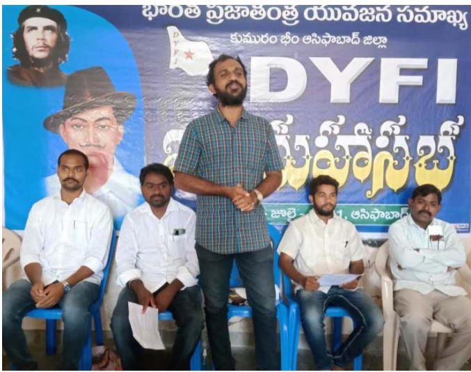
ఆసిఫాబాద్ జిల్లా ప్రతినిధి జూలై 18, ప్రజాపాలన :జిల్లా కేంద్రంలోని మాతృశ్రీ డిగ్రీ కళాశాలలో భారత ప్రజాతంత్ర యువజన సమాఖ్య (డివైఎఫ్ఐ) జిల్లా ద్వితీయ మహాసభలను ఆదివారం నిర్వహించారు. ఈ