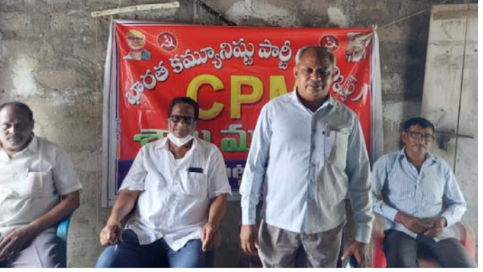
బంగారు తెలంగాణ కాదు భ్రమల తెలంగాణగా మార్చిన