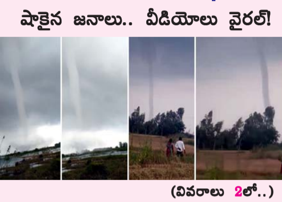
షాకైన్ జనాలు.. వీడియోలు వైరల్! (వివరాలు 2లో..)