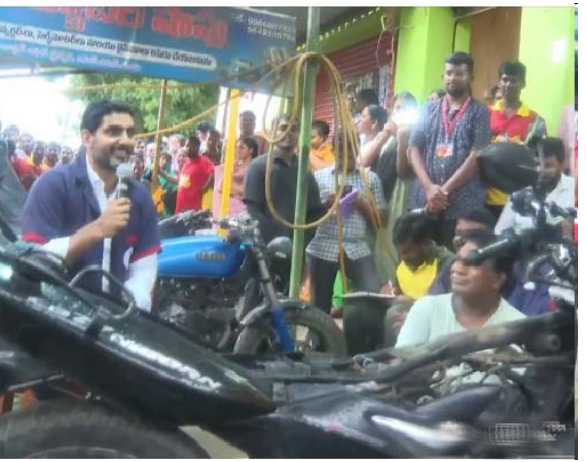
సంతనూతలపాడు నుంచి ప్రారంభమైన పాదయాత్ర... ఎండూరు, పేర్మిట్ట మీదుగా ఒంగోలు శివారు పాలకేంద్రం

సంతనూతలపాడు : సంత నూతలపాడు నియోజకవర్గంలో 165వ రోజు యువగళం పాదయాత్ర ఉత్సాహంగా సాగింది. సంతనూతలపాడు శివారు విడిది కేంద్రం నుంచి ప్రారంభమైన పాదయాత్రకు దారిపాదపునా వివిధ వర్గాల ప్రజలనుంచి అపూర్వ స్పందన లభించింది. బైక్ మెకానిక్ లతో సమావేశమైన యువనేత వారి సాధకబాధకాలు తెలుసుకున్నారు. ఈ సందర్భంగా లోకేష్ బైక్ మెకానిక్ ల తరహాలో దుస్తులు ధరించడం విశేషం.