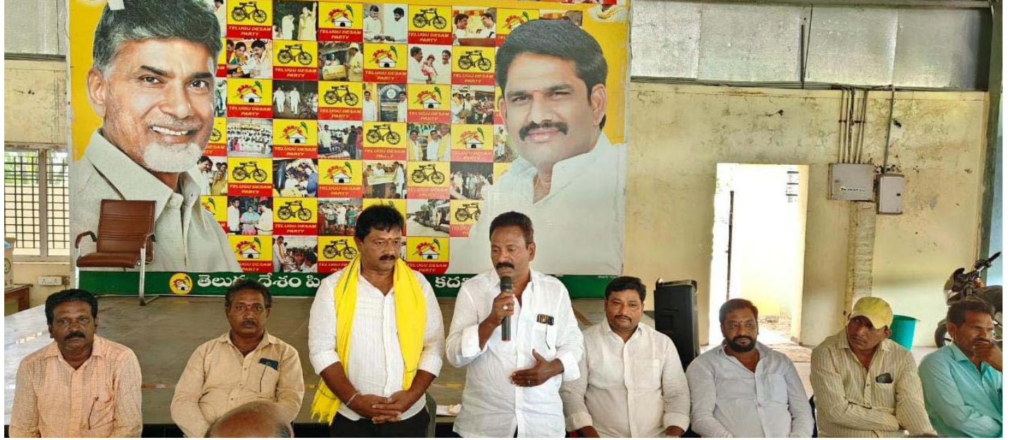
సన్నాహక సమావేశంలో టిడిపి నేతలు