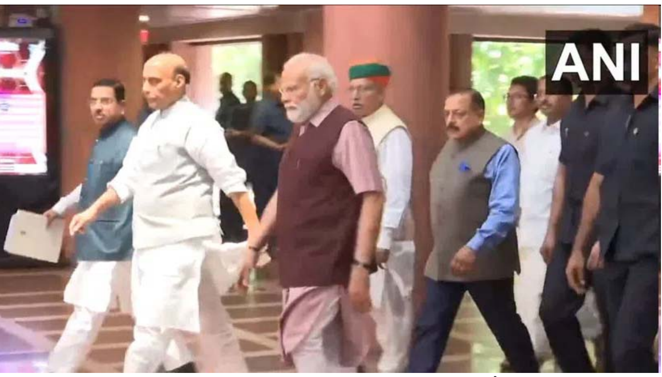
విమర్శించారు. దేశం పేరును వాడుకుని ఆరోపించారన్నారు. ఓడిపోయి, అలసిపోయి, ప్రధాని పేర్కొన్నారు. ప్రజల్ని తప్పుదోవ పట్టించలేరని ప్రధాని ఆశలేని పార్టీలుగా విపక్షాలు మిగిలిపోయినట్లు

ఇండియన్ నేషనల్ కాంగ్రెస్, ఈస్ట్ ఇండియా కంపెనీ లాంటి పార్టీలను కూడా విదేశీయులు ప్రారంభించినట్లు ప్రధాని మోదీ