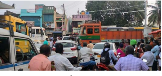
ప్రజాపాలన న్యూస్ ఏర్పేడు ప్రతినిధి. పూతలపట్టు- నాయుడుపేట వెళ్ళే జాతీయరహదారిలో ఏర్పేడు కూడలిలో మెట్రో ఎక్స్ప్రెస్ బస్ ఇంజనీర్ సాంకేతిక కారణాలవలన బస్ ఆగిపోయింది. అందుకుగాను ట్రాఫిక్ జామ్ అయ్యింది.