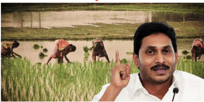
కార్యవరణ సిద్ధం చేయాలన్నారు. భూసార పరీక్షలు చేసే పరికరాలను ఆర్గ్విలో ఉంచాలన్నారు.

అమరావతి, ప్రజాపాలన ప్రతినిధి: అధికారులు రబీకి అన్ని రకాలుగా సిద్ధంగా ఉండాలని ఆంధ్రప్రదేశ్ రాష్ట్ర ముఖ్యమంత్రి వైఎస్ జగన్మోహన్ రెడ్డి అన్నారు. వ్యవసాయ శాఖపై సీఎం జగన్ న మీక్ష నిర్వహించారు. ఈ సందర్భంగా సీఎం జగన్ మాట్లాడుతూ ఎంపీ కన్నా తక్కువ ధరకు అమ్ముకోవాల్సి వచ్చిందనే మాట రావడం సీఎం జగన్ సూచించారు. దీన్ని అధికారులు సవాల్ గా తీసుకోవాలన్నారు. ధాన్యం కొనుగోలులో మిల్లర్ పాత్ర లేకుండా చేస్తున్నామన్నారు. వ్యవసాయ శాఖపై పౌరసరఫరాల శాఖ అనుసంధానం కావాలన్నారు. రైతులకు మంచి జరిగేలా తగిన చర్యలు తీసుకోవాలన్నారు. ప్రతి ఆర్గ్విలో ఒక డ్రోస్ ను ఉంచేలా