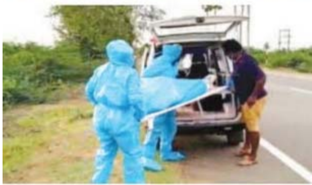
వంటి వసులు చేయకూడదు, మరియు వాటిని అనుమతించకూడదు. శవపరీక్షలు చేయడం, నిర్వహించడం

చేయకూడదు. మృతదేహానికి చెందిన కుటుంబసభ్యులకు మరియు బంధువులకు చేసిన సూచనలు. మరణించిన వ్యక్తి శరీరము బాడ్ బ్యాగ్ లో చుట్టబడిన తర్వాత మాత్రమే మృతదేహాన్ని బంధువులకు అప్పగించడము జరుగుతుంది. మృతదేహాన్ని దహన లేదా బరియాల్ కి తరలించిన తరువాత, మృతదేహం తరలించిన వాచనము మరియు సిబ్బంది 1% సోడియం హైపో క్లోరైట్ తో క్రిమి సంహారకము చేసుకోవాలి. మృతదేహానికి స్నానం చేయించడం, మృతదేహాన్ని ముద్దు పెట్టుకోవడం, కౌగిలించుకోవడం వంటివి అనుమతించబడవు. శ్మశానవాటిక లేదా బరియాల్ మైదానంలో 20 కి మించి వ్యక్తులు సమావేశం కాకూడదు. మృతదేహం యొక్క దగ్గరి కుటుంబ కుటుంబసభ్యుల తో వైరస్ ప్రమాదము ఉంటుంది కాబట్టి అక్కడ వారితో తగిన బౌతిక దూరం పాటించండి. వ్యక్తి కర్మకాండల నిర్వహణ నిమిత్తము బూడిదను అప్పగిస్తారు. పైన సూచించబడిన సూచనలు అమలు చేయటం శ్మశాన వాటిక సిబ్బందికి తగు విధంగా అవగాహన కల్పించడం జరిగింది. స్థానిక మున్సిపల్ అధికారులకు సూచించిన చర్యలు. మృతదేహాన్ని బాడ్ బ్యాగ్ ఉంచి ఆపై సరైన వస్త్రము తో సరిగ్గా చుట్టబడినది అని నిర్ధారించుకున్నా తరువాత మాత్రమే మృతదేహాన్ని స్నానం చేసుకోవాలి. మృతదేహాన్ని దహన లేదా ఖననం చేయడానికి రవాణా చేసే వాహనం మరియు సిబ్బంది 1% సోడియం హైపో క్లోరైట్ తో క్రిమిరహితం చేసుకోవాలి. సాధ్యమైనంత వరకు దహన సంస్థారాలు ఎలక్ట్రికల్ పద్ధతి ద్వారా