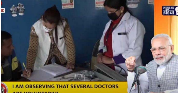
I AM OBSERVING THAT SEVERAL DOCTORS ARE VOLUNTARILY...

అత్యుత్తమ ప్రతినిధి: కరోనా మహమ్మారికి తప్పదు సమాచారాన్ని ప్రచారం చేస్తున్నారని, అలాంటి తప్పుడు సమాచారాన్ని ప్రజలు అస్సలు నమ్మవద్దని ప్రధాని సూచించారు. నమ్మకమైన ప్రసార మాధ్యమాల నుంచి మాత్రమే ప్రజలు కరోనాకు సంబంధించిన సమాచారాన్ని ప్రయత్నాలు చేస్తున్న అన్ని రకాల ప్రయత్నాలకు కేంద్ర ప్రభుత్వ సహకారం ఉంటుందని ఆయన మంది వైద్యులు కూడా సోషల్