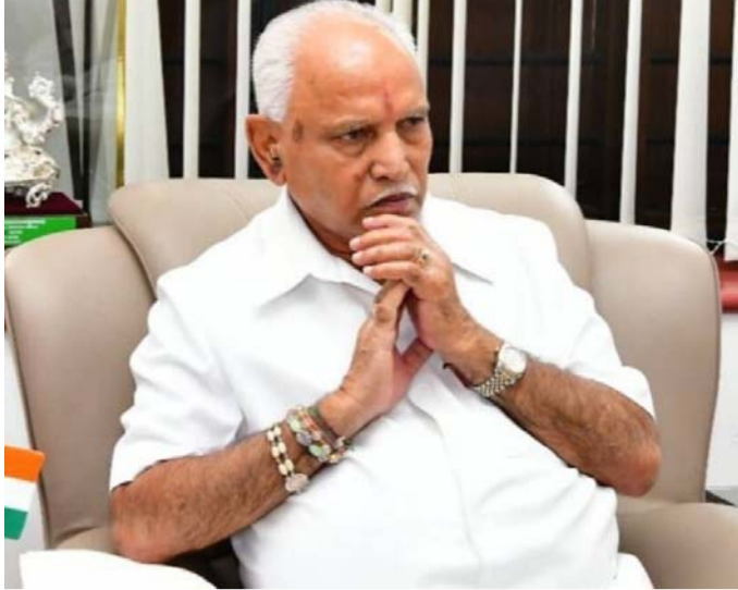
కుమారుల జోక్యం, వారి పై కుమారులకు పార్టీలోనూ, అవినీతి ఆరోపణలు రావడం, ప్రభుత్వంలోనూ భాగస్వాములను యడ్డూరప్పకు 70 ఏళ్లు దాటడంతో చేయాలని షరతు విధించారు. రాజీనామా చేయాలని హైకమాండ్ మొత్తం మీద యడ్డూరప్ప ముఖ్యమంత్రిగా పూర్తికాలం నిర్ణయమయ్యారు. అయితే తమ ఎప్పుడూ కొనసాగలేకపోయారు.

బెంగళూర్, జులై 25, ప్రజాపాలన ప్రతినిధి : యడ్డూరప్ప కు ముఖ్యమంత్రిగా కొనసాగింది కొద్ది మంది మాత్రమే. చివరిగా కాంగ్రెస్ ముఖ్యమంత్రిగా సిద్ధరామయ్య బద్దేళ్ల పాటు ముఖ్యమంత్రిగా చేసినా, అధికారం చేపట్టిన ప్రతిసారీ ఏదో ఒక అవినీతి ఆరోపణలు రావడం, వదలి నుంచి దిగిపోవడం సాధారణంగా మారింది. యడ్డూరప్ప పూర్తికాలం ఎప్పుడూ వ్యవస్థాపక మంత్రిగా కొనసాగలేకపోయారు. నిజానికి భారతీయ జనతా పార్టీ జెండాను దక్షిణాదిని నిలిపింది యడ్డూరప్ప మాత్రమే. ఆయన సామాజికవర్గం పరంగా బలమైన నేత కావడంతో ఇక్కడ బీజేపీ తన ఉనికిని చాటుకోగలిగింది. 2006లోనూ కర్ణాటకలో ముఖ్యమంత్రిగా కొనసాగింది కొద్ది మంది మాత్రమే. చివరిగా కాంగ్రెస్ ముఖ్యమంత్రిగా సిద్ధరామయ్య బద్దేళ్ల పాటు ముఖ్యమంత్రిగా చేసినా, అధికారం చేపట్టిన ప్రతిసారీ ఏదో ఒక అవినీతి ఆరోపణలు రావడం, వదలి నుంచి దిగిపోవడం సాధారణంగా మారింది. యడ్డూరప్ప పూర్తికాలం ఎప్పుడూ వ్యవస్థాపక మంత్రిగా కొనసాగలేకపోయారు. నిజానికి భారతీయ జనతా పార్టీ జెండాను దక్షిణాదిని నిలిపింది యడ్డూరప్ప మాత్రమే. ఆయన సామాజికవర్గం పరంగా బలమైన నేత కావడంతో ఇక్కడ బీజేపీ తన ఉనికిని చాటుకోగలిగింది. 2006లోనూ బీజేపీ, జేడీఎస్ సంకీర్ణ ప్రభుత్వం ఏర్పడినా అప్పట్లో జేడీఎస్ మద్దతు వెనక్కు తీసుకోవడంతో యడ్డూరప్ప ప్రభుత్వం కుప్పకూలిపోయింది. మరోసారి ఆయనపై అవినీతి ఆరోపణలు రావడంతో రాజీనామా చేయాల్సి వచ్చింది. 2018 ఎన్నికల్లో బీజేపీ అతి పెద్ద మెజారిటీ రావడంతో యడ్డూరప్ప ముఖ్యమంత్రిగా బాధ్యతలు స్వీకరించి బలం లేక బదు రోజులకే రాజీనామా చేయాల్సి వచ్చింది. ఇప్పుడు తాజాగా యడ్డూరప్ప మరోసారి రాజీనామా చేయనున్నట్లు వార్తలు వస్తున్నాయి. ఆరోగ్యం సరిగా లేకపోవడం, పార్టీ నుంచి వత్తిడులు రావడంతో ఆయన పదవి నుంచి తప్పుకోవడం అనివార్యమైంది. యడ్డూరప్ప