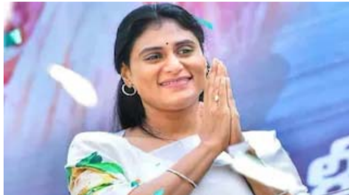
ఆమెతో వెళ్లే నాయకులు మినహా కనీసం 50 మంది కూడా రావడంలేదు. నిరుద్యోగ సమస్యపై ప్రభుత్వంతో పోరాడుతున్నా ఇంత తక్కువ జనం రావడం ఆమెకు జనాలకు చేరువకావడం లేదని తెలుస్తోంది. అందుకే నిరుద్యోగ యువత కోసం ప్రతి మంగళవారం నిరాహార దీక్షకు పూనుకున్నా.. పెద్దగా ఆసక్తి కనబరచడంలేదని నేతలు భావిస్తున్నారు. దీనికి జగన్ వైఖరి కూడా ఇలాగే ఉండేదని, సీఎంగా లేని సమయంలోనూ ఎంత అత్యయ్యులైనా సరే.. అని పిలవాల్సిందేనని ఆదేశించేవారని విశ్లేషకులు చెబుతున్నారు. వైఎస్సార్ టీపీ అధినేత్రి షర్మిల చేపడుతున్న జిల్లాల వర్కలనులో జనం పెద్దగా ఆదరించడంలేదని పలువురు నాయకులంతా వైఎస్సార్ టీపీకి

చెందిన పలువురు కీలక నేతలు చేరుతారని చెప్పి చివరకు ఉ సూరుమనిపించారు. వైఎస్సార్ టీపీ అధినేత్రి షర్మిలను నాయకులు, వైఎస్సార్ అభిమానులు 'షర్మిలమ్మ' అని పిలవాలని ఆమెకు అత్యంత నన్నిహితంగా ఉండే నేతలు ఆదేశించినట్లుగా తెలుస్తోంది. అలా పిలవడం హుందాతనానికి నిదర్శనంగా లోటన్ పాండ్ వర్గీయులు భావిస్తున్నట్లు సమాచారం. ఇది ఇక్కడ ప్రజలకు కారణంగా చెబుతున్నారా కొందరు నేతలు. గతంలో వలుమార్లు తెలంగాణ యాసను అనుకరించేందుకు షర్మిల ప్రయత్నించినా పెద్దగా పర్ఫుట్ అయినట్లుగా కనిపించడంలేదు. తెలంగాణ ప్రజలను ఆకట్టుకోవాలంటే ఈ విధానం సరిపోదని పలువురు నేతలు భావిస్తున్నారు. దీనికి తోడు ఆమె ప్రతి మినిస్టర్ లో చెప్పే అంశాలనే తిరిగి మరో మీటింగ్లోనూ చెప్పడం వల్ల కూడా కొంత మైన్స్ అవుతున్నట్లు వారు చెబుతున్నారు. దీనివల్ల పార్టీలో చేరేవారి సంగతి పక్కన పెడితే దూరమయ్యే వారే అధికమవుతారనే ప్రచారం జరుగుతోంది. పార్టీ ఆవిర్భావం సమయంలోనూ ఇతర పార్టీలకు