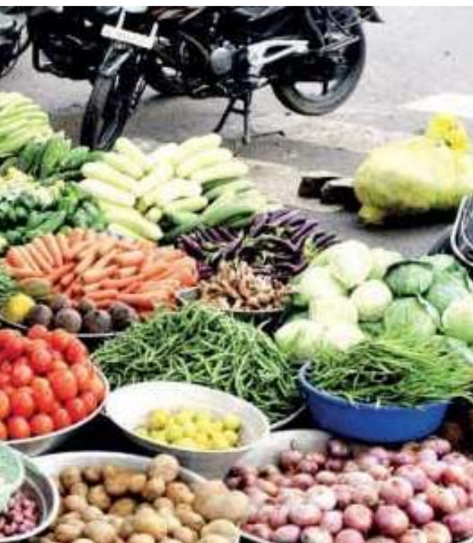
ఇచ్చేవారు. కూరగాయల రేట్లు పెరిగిపోవడంతో కోడిగుడ్డ వాడకం పెరిగింది. ఒకరోజు కూరగాయ లకు పెట్టే ఖర్చును పెడితే 30 గుడ్డ లకు పట్టే ఖర్చును పెడితే 30 గుడ్డ వచ్చున్నది. హాల్ సేల్ మార్కెట్లో 30 గుడ్డ ధర ఏరియాను బట్టి వంద వరకు పెరిగింది. దీంతో హాల్ సేల్ లో కిలో టమాట రూ. 50 వలుకుతున్నది. అదే

టమాట రెండు, మూడు చేతులు మారి బహిరంగ మార్కెట్లోకి వచ్చేసరికి 65 రూపాయల నుంచి 80 రూపాయలు అమ్ముడవు తున్నది. దీనికంతటికీ అనీజన్, కరోనా ఎఫెక్ట్ అని తెలుస్తున్నది. గతేడాది ఇదే సీజన్లో హైదరాబాద్ మార్కెట్ కు వచ్చే టమాట దిగుబడి సగానికి పడిపోయిందని, ప్రస్తుతం అధికారులు చెబుతున్నారు. అధికారులు రాష్ట్రంలోని రంగారెడ్డి, సిద్దిపేట, మెదక్, నిజామాబాద్, మహబూబ్ నగర్ తదితర ప్రాంతాల నుంచే కాకుండా కర్ణాటక, ఏపీ రాష్ట్రాల నుంచి కూడా దిగుమతి అవుతున్నది. కర్ణాటక, ఆంధ్రప్రదేశ్ రాష్ట్రాల్లో కరోనా వ్యాప్తి వేగంగా ఉండటంతో అక్కడ నుంచి టమాట రావడం తగ్గింది. అపటి మార్కెట్లో బెంగళూరు అనుబంధ కార్యాలయం లేదు. మిగతా కూరగాయల రేట్లు కూడా టమాట ధరతో పోటీ పడి మరి పెరుగుతున్నాయి. హాల్ సేల్ మార్కెట్లో 40 కేజీల మిర్చి బస్తా ధర 2600 వలుకుతున్నది. అంటే