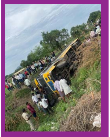
నరసరావుపేటకు చేరువలో మాయాజాలం ప్రదర్శించిన ఓ ప్రముఖ సూల్ బస్సు యాక్సిడెంట్ ఉదంతం (వివరాలు 2లో..)