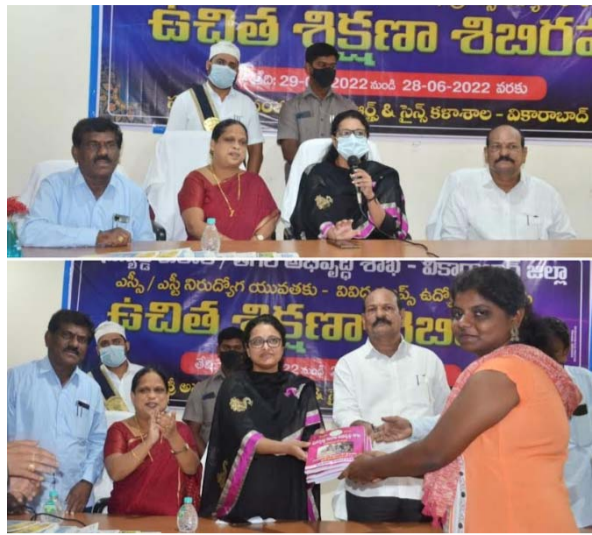
మెటీరియల్ అందజేశారు. ఈ సందర్భంగా కలెక్టర్ మాట్లాడు