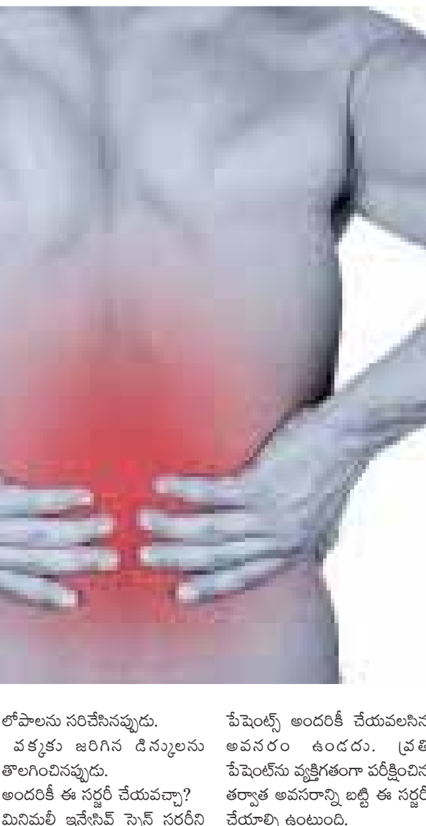
డిస్కుల అరిగిపోవడం, లోపాలను సరిచేసినప్పుడు, వక్రకూ జరిగిన డిస్కులను తొలగించినప్పుడు...

పంపిస్తారు. ఈ రంగాలపై సర్జికల్ టెక్నాలజీ వేయడం వల్ల ఏర్పడిన మచ్చలు కొద్ది నెలల్లోనే శరీరంపై మాయమవుతాయి.