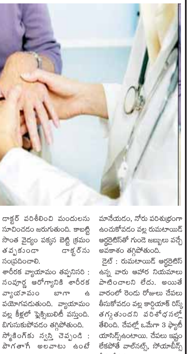
ఆమేయం వల్ల తిరిగి వచ్చి, నొప్పి ప్రారంభమవుతుంది. ఆ తరువాత తగ్గడం చాలా కష్టమవుతుంది.

ఇన్ఫెక్షన్లు, శ్వాసకోశ సమస్యలు, ఆర్థరైటిస్ మూలంగా పురుషుల్లో ఏడేళ్లు, స్త్రీలలో మూడేళ్లు జీవితకాలం తగ్గిపోతోంది. అందుకే నిర్లక్ష్యం చేయకుండా కీళ్ల నొప్పులు బాధిస్తున్నట్లుంటే రుమటాయిడ్ కలవాలి.