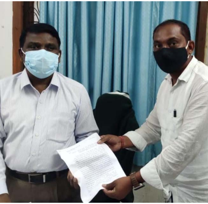
మురికి కాలువ నిర్మాణం చేపట్టి ఇబ్బందులు