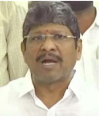
బకాయిలను వెంటనే చెల్లించకపోతే ఉద్యమం