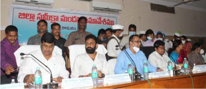
ఇన్ఫర్మేషన్ మంత్రి కొడాలి నాని అధ్యక్షతన