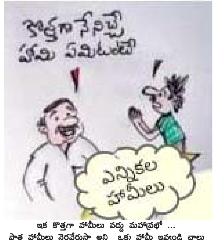
ఇక కొత్తగా హామీలు వద్దు మహాప్రభో... పాత హామీలు నెరవేరుస్తా అని ఒక్క హామీ ఇవ్వండి చాలు