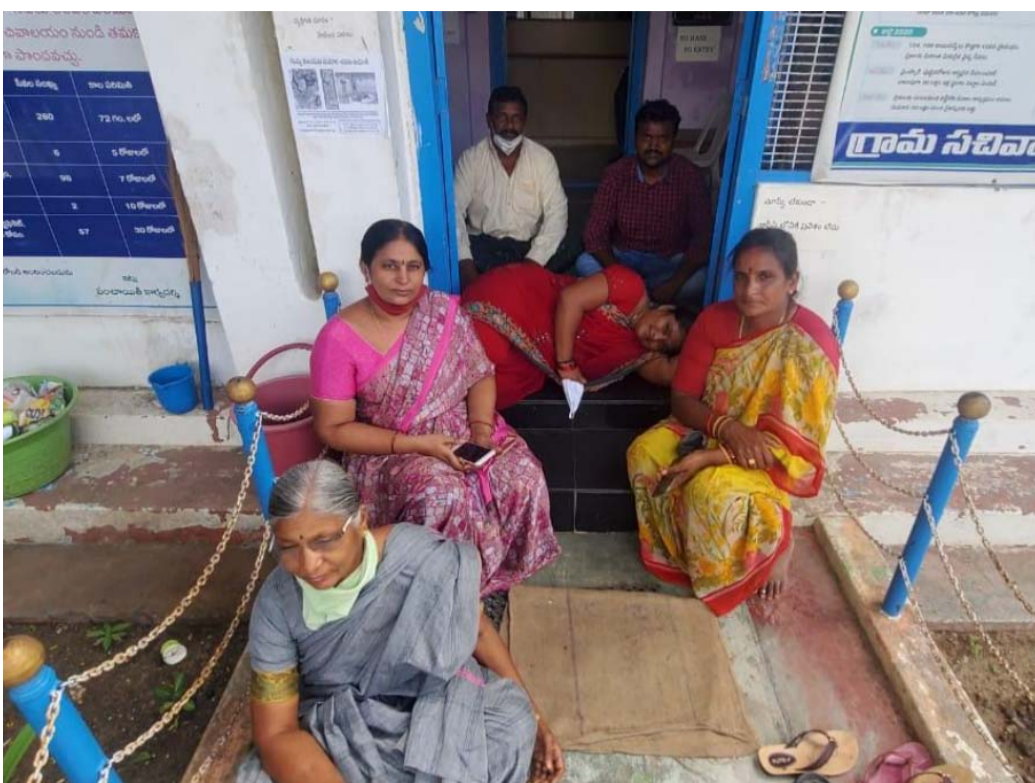
టెండర్లు ఆయన పాడినట్లుగా వారి జీతాలు కూడా అకౌంట్లో జమ చేశారు. గ్రామపంచాయతీ శానిటరీ మేట్రి విధులు నిర్వహిస్తున్న...