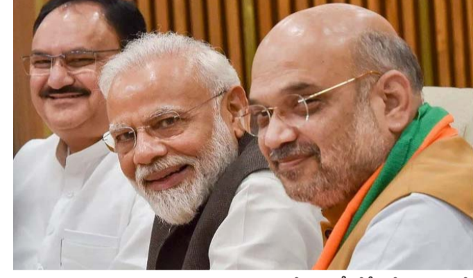
హైదరాబాద్, ప్రజాపాలన ప్రతినిధి: హైదరాబాద్ లో ఈ వారం జరిగే జాతీయ కార్యవర్గ

జులై 2,3 తేదీల్లో బీజేపీ నేషనల్ ఎగ్జిక్యూటివ్ మీట్ భాగ్యనగరానికి తరలిరానున్న కమలదళం హైదరాబాద్ వేదికగా కమలం కొత్త వ్యాహం దక్షిణాభిలో విస్తరణపై సమగ్ర చర్చ తెలంగాణలో అధికారం కోసం దిశానిర్దేశం