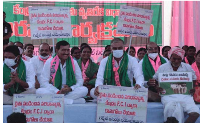
బీజేపీ చేసిందేంటి? రైతుల కోసం సీఎం చేయాల్సింది చేశారన్నారు. వంట కొనుగోలుపై చేతులెత్తిన కేంద్రం..