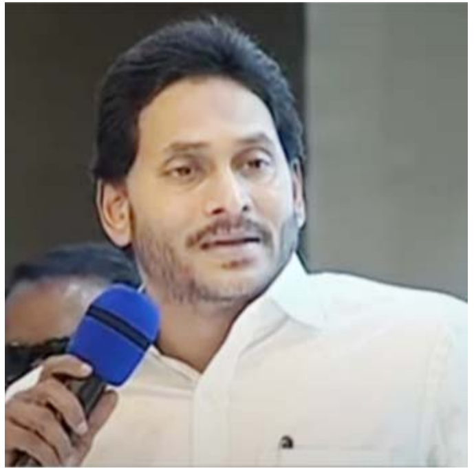
విజయవాడ : విజయవాడలో మంగళవారం నిర్వహించిన ‘జగనన్న ఆణిముత్యాలు’ కార్యక్రమంలో టెన్స్, ఇంటర్లో ప్రతిభ కనబరిచిన

ప్రతిభ కనబల్లిన విద్యార్థులకు నగదు పురస్కారాలిచ్చిన సిఎం జగన్