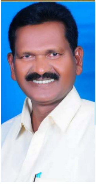
బాపట్ల, ప్రజాపాలన ప్రతినిధి: సమాజంలో కుల నిర్మూలన అనే అంశం మరుగున పడిపోయి,

ఆంధ్రప్రదేశ్ షెడ్యూల్డ్ కులాల సంక్షేమ సంఘం