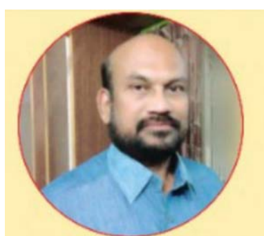
దానమ్మగారి కృష్ణమూర్తి మహాబోధి సాహిత్య వేదిక.

ఆకలితో ఆకులలములు వేటాడిన మాంసం పూట పూటకు తెచ్చుకొంటూ కడుపారా తినీ తాగి కంటినిండా నిర్దోయిన ఆ మనిషీ! అట పాట మాట నేర్చుకొని అక్షరాలై నాగరికం పేరుపెట్టి ఎండ గాలి వాన రంగు రుచులన్నీ కనిపెట్టి నాదినదనే ఈ మనిషీ! అదీ చాలక దొరికేవన్నీ నాకెంతంటూ దోచుకుంటూ దాచుకుంటూ ఆశమీరి ఆకృతిల్లె కొల్లగొట్టి విధ్వంసంకొన్న వికృతుడై ఈ మనిషీ! మట్టి ఇసుక రాళ్లు నేల నీరు కొండ గుట్ట చెట్లు పంట ఆకు కనిపించి చేత చిక్కి దేవుని కొల్లగొట్టే పర్యావరణ భక్తుడై ఈమనిషి