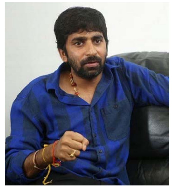
సినిమా చేస్తున్నాడు. ఈ సినిమా ఒక్కటే నాగ్ లాక్ చేసిన అధికారిక ప్రాజెక్ట్. కాబట్టి గోపీచంద్ -కింగ్ తో సినిమా చేయడానికి ఎక్కువ సమయం పట్ట ఛాన్స్ లేదు. అన్ని అనుకున్నట్లు జరిగితే ఇదే ఏడాది ప్రారంభమయ్యే అవకాశం ఉందని తెలుస్తుంది.