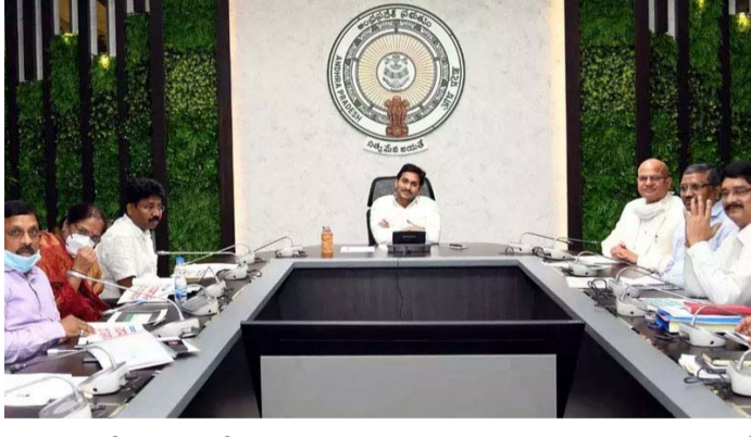
ప్రకటనలో స్పష్టం చేసింది. తల్లిదండ్రులు పిల్లలను బడికి పంపకపోతే ఆన్ లైన్ క్లాసులు నిర్వహించాలని.. పాఠశాలల వేళలపై పరిస్థితిని బట్టి డిసెంబర్లో నిర్ణయం తీసుకుంటామని సీఎం జగన్ తెలిపారు. నవంబర్ వరకు ఇలా అమలువుతుందని పరిస్థితిని బట్టి డిసెంబర్లో నిర్ణయం తీసుకుంటామని జగన్ తెలిపారు.

అమరావతి, అక్టోబర్ 20, ప్రజాపాలన : ప్రపంచాన్ని వణికిస్తున్న కరోనా మహమ్మారి నేపథ్యంలో మాతపడిన స్కూళ్ల రి-ఓపెనింగ్కు ఏపీ విద్యాశాఖ ముహూర్తం ఫిక్స్ చేసింది. ఇవాళ విద్యాశాఖ ఉన్నతాధికారులతో సీఎం వైఎస్ జగన్ మోహన్ రెడ్డి సమీక్ష నిర్వహించారు. నిశితంగా అన్ని విషయాలపై చర్చించిన అనంతరం స్కూళ్లు పునఃప్రారంభించాలని సీఎం నిర్ణయించారు. నవంబర్-02 నుంచి రాష్ట్రంలో స్కూళ్లు పునఃప్రారంభం కానున్నాయని జగన్ తెలిపారు. ఒక్క పూట మాత్రమే స్కూళ్లు ఉంటాయని సీఎం తెలిపారు. ఒంటిపూట బదులతో పాటు మధ్యాహ్నం భోజన పథకం కూడా అమలువుతుందన్నారు. స్కూళ్లు మధ్యాహ్నం వరకు మాత్రమే పనిచేస్తాయని.. మధ్యాహ్నం భోజనం పెట్టి విద్యార్థులను ఇంటికి పంపిస్తారని జగన్ చెప్పారు. రెండోరోజులకు ఒకసారి తరగతులు నిర్వహించనున్నట్లు విద్యాశాఖ తెలిపింది. 1,3,5,7 తరగతుల విద్యార్థులకు ఒక రోజు మాత్రమే క్లాసులు జరగనున్నాయి. 2,4,6,8 తరగతులకు మరో రోజు క్లాసులు జరగనున్నాయి. విద్యార్థుల సంఖ్య 750కి పైగా ఉంటే మూడోరోజులకోసారి తరగతులు నిర్వహిస్తామని విద్యాశాఖ ఓ ప్రకటనలో స్పష్టం చేసింది. తల్లిదండ్రులు పిల్లలను బడికి పంపకపోతే ఆన్ లైన్ క్లాసులు నిర్వహించాలని.. పాఠశాలల వేళలపై పరిస్థితిని బట్టి డిసెంబర్లో నిర్ణయం తీసుకుంటామని సీఎం జగన్ తెలిపారు. నవంబర్ వరకు ఇలా అమలువుతుందని పరిస్థితిని బట్టి డిసెంబర్లో నిర్ణయం తీసుకుంటామని జగన్ తెలిపారు.