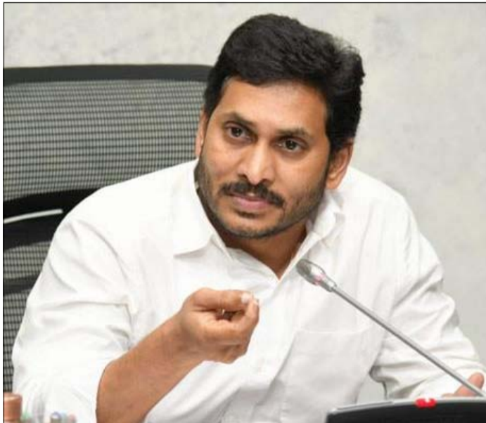
సీఎం జగన్ ఇంకా ఎవ్వరూలే.. రాష్ట్ర చరిత్రలో తొలిసారిగా రాష్ట్ర చరిత్రలో తొలిసారిగా ఒక సీజన్ ఇన్ ఫుట్ సబ్సిడీని అదే సీజన్లో ఇస్తున్నాం. ఈ ఏడాది ఖరీఫ్ ఇన్ ఫుట్ సబ్సిడీని వైయస్సార్ రైతు భరోసా రెండో విడత చెల్లింపులతో పాటు ఇవ్వబోతున్నాం. మగతా 2లో..