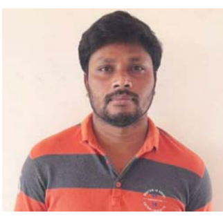
మహాసభలో తీరుకున్న తీర్మానాలపై, యువత ఎదుర్కొంటున్న సమస్యల పరిష్కారానికై రాజీలేని పోరాటాలు చేసేందుకు ఈ రాష్ట్ర మహాసభలో తీర్మానాలు జరిగినట్లు ఆయన తెలిపారు.

తెలిపారు. ప్రధానంగా నిరుద్యోగులకు ఉద్యోగాల సౌకర్యాలను, జాబ్ క్యాలెండర్ విడుదల చేయాలని తీర్మానం, విద్య, వైద్యం లను ప్రైవేట్, కార్పొరేట్ కరణ చేయడానికి వ్యతిరేకంగా తీర్మానం, స్థానిక సంస్థలో, పరిశ్రమలలో స్థానికులకే ఉద్యోగాలు ఇవ్వాలని తీర్మానం, ప్రతి మండల, నియోజకవర్గ కేంద్రాల్లో యువతకు మినీ స్టేడియంలను ఏర్పాటు చేయాలని తీర్మానం, అమ్మాయిలు, మహిళలపై జరుగుతున్న దాడులనకు, అత్యాచారాలకు వ్యతిరేకంగా అరికట్టాలని తీర్మానం ఇంకా అనేక సమస్యలపై తీర్మానాలు చేయడం జరిగిందని తెలిపారు. భవిష్యత్ లో