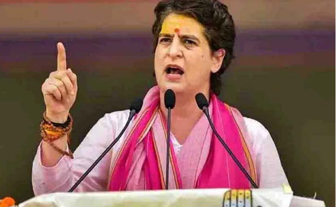
దరుసీయమైన స్థితిలో ఉండంటే కనీసం పాతిక స్థానాలు వచ్చినా చాలా అస్తుంతుగా తొమ్మిదో దశకం నుంచి ఉత్తరప్రదేశ్ రాజకీయాలు సమూలంగా మార్పు చెందాయి. అక్కడ కుల రాజకీయాలు పెరిగాయి.

ఉత్తరప్రదేశ్: ఉత్తరప్రదేశ్ లో కాంగ్రెస్ పార్టీ అధికారం చేజిక్కుకుని మూడు దశాబ్దాలు దాటింది. 1985 ఎన్నికల్లో 269 స్థానాలు సంపాదించిన కాంగ్రెస్ పార్టీకి ఆ తర్వాత మూడెంకల సీట్లు సాధించడం దుర్భరంగా మారింది. 1989 ఎన్నికల్లో జనతాదళ్ 208 సీట్లు సాధించి అధికారంలోకి వచ్చింది. అప్పుడు కాంగ్రెస్ పార్టీకి వచ్చినవి 94 సీట్లు మాత్రమే. మరోవైపు భారతీయ జనతాపార్టీ 57 సీట్లు గెలుపుకుంది. అది మొదలు అక్కడ కాంగ్రెస్ రోజురోజుకూ క్షీణిస్తూ వస్తోంది. ఇప్పుడెంత