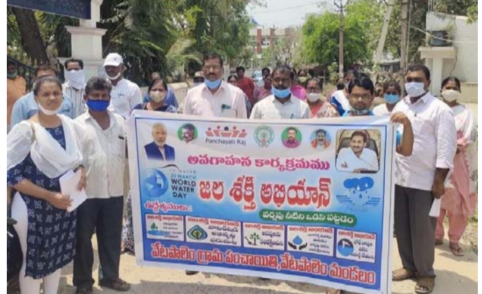
వేటపాలెం, ప్రజాపాలన ప్రతినిధి: జల శక్తి అభియాన్ కార్యక్రమం పై ప్రజలలో అవగాహన పెంపొందించాలని మండల ప్రత్యేక అధికారి, చేనేత జొలి శాఖా ఉపసంచాలని నిందిస్తూ ర్యాలీ నిర్వహించారు. కారి, చేనేత జొలి శాఖా ఉపసంచాలని నిందిస్తూ ర్యాలీ నిర్వహించారు. అనంతరం జల సంరక్షణ ప్రతిజ్ఞ చాలకులు శ్రీనివాసరావు అన్నారు. సోమవారం కేంద్ర ప్రభుత్వం ఏర్పాటు చేసిన జల శక్తి అభియాన్ కార్యక్రమంలో భాగంగా వేటపాలెం పంచాయతీ కార్యాలయం నుండి

నీటి పారుపు, వర్షపు నీటిని ఒడిసి పట్టడం, చెట్లు పెంచటం వంటి, జల సంరక్షణ వంటి అంశాలను నిందిస్తూ ర్యాలీ నిర్వహించారు. అనంతరం జల సంరక్షణ ప్రతిజ్ఞ చేశారు. వేటపాలెం రైతు భరోసా సోమవారం కేంద్ర ప్రభుత్వం ఏర్పాటు చేసిన జల శక్తి అభియాన్ కార్యక్రమంలో భాగంగా వేటపాలెం పంచాయతీ కార్యాలయం నుండి