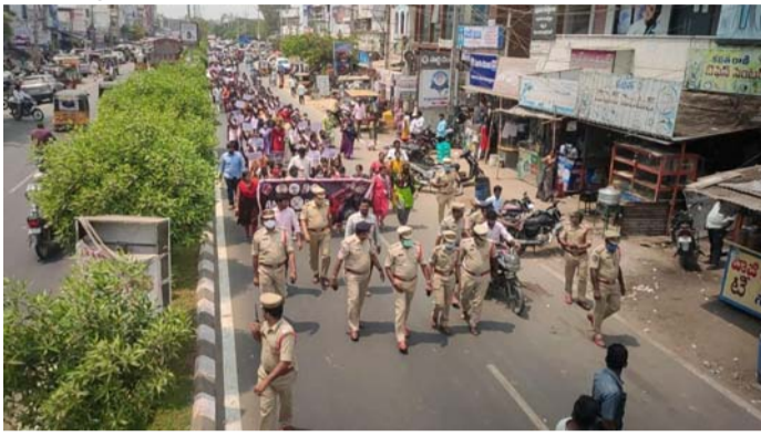
ముఖ్యమంత్రి జగన్మోహన్ రెడ్డి ఆదేశాల మేరకు రాష్ట్ర వ్యాప్తంగా యాంటీ డ్రగ్ వీక్ కార్యక్రమంలో