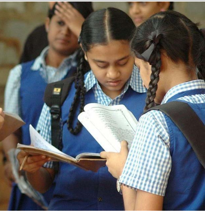
సమసమాజానికి 'చదువే ఆయుధం'

సమానత్వాన్ని మహిళా హుందాను చాలా దేశాలు రాజ్యాంగ బద్ధంగానో లేదా చట్టబద్ధంగానో గుర్తించాయని ఆయన అన్నారు. 'పక్షపాతం దురభిమానం అన్యాయానికి దారి తీయాలని, ముఖ్యంగా వైసారిటీ వర్గాల విషయంలో అన్యాయానికి దారి తీయాలని ఆయన నొక్కి చెప్పారు. భవిష్యత్తులో ఆయన భారత న్యాయస్థానాలలో పక్షపాతం, దురభిమానాలకు ఎలా బాధితులు అవుతున్నారో విశదం చేయగలరని నేను ఆశిస్తున్నాను. ప్రభుత్వం తన పౌరులకు శ్రేయో పాలన నందిస్తోందా? సిజెబి రమణ ఇలా అన్నారు: 'పౌరులు తమను పాలించే చట్టాల నిర్మాణంలో ప్రత్యక్షంగానో, పరోక్షంగానే భాగస్వాములు కావడమే ప్రజాస్వామ్య ముఖ్యసూత్రం. భారత్లో ఇది ఎన్నికల ద్వారా జరుగుతోంది. సార్వజనీన ఓటు హక్కు ద్వారా ప్రజలు తమ ప్రతినిధులను ఎన్నుకుంటున్నారు. చట్టసభలలో వారు