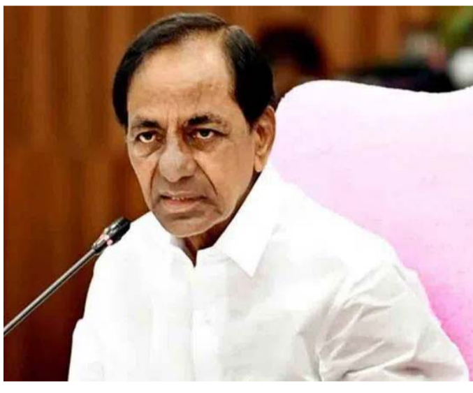
మంజూరు చేసింది. ఇందులో కొత్తగా 3 చీఫ్ ఇంజనీర్ పోస్టులు, 12 సూపరిండెంట్ ఇంజనీర్ పోస్టులు, 13 ఎక్సిక్యూటివ్ ఇంజనీర్ పోస్టులు, 102 డీఈఈ పోస్టులు, 163 అసిస్టెంట్ ఈఈ పోస్టులు, 28 డివిజనల్ అకౌంట్స్ ఆఫీసర్ పోస్టులతో పాటు పలు టెక్నికల్, నాన్ టెక్నికల్ సిబ్బంది పోస్టులున్నాయి. (మిగతా 2లో..)

హైదరాబాద్ : ముఖ్యమంత్రి కేసీఆర్ ఆధ్వర్యంలో జరిగిన రాష్ట్ర మంత్రి వర్గం కీలక నిర్ణయం తీసుకుంది. రోడ్డు భవనాల శాఖలో పెరిగిన పనికి అనుగుణంగా శాఖను పునర్ వ్యవస్థీకరించేందుకు కేబినెట్ నిర్ణయించింది. ఇందులో భాగంగా ఆర్ అండ్ బీ శాఖలోని పలు విభాగాల్లో మొత్తం 472 అదనపు పోస్టులను కేబినెట్ మంజూరు చేసింది. రాష్ట్రంలో వ్యవసాయంతో పాటు పలు రంగాల్లో రోజు రోజుకూ పెరుగుతున్న అభివృద్ధికి అనుగుణంగా రోడ్డు భవనాల శాఖలో పని విస్తృతి పెరుగుతున్నదని, అందుకు అనుగుణంగా శాఖలోని పలు విభాగాలను పటిష్టం చేయాలని, ప్రజా రవాణా వ్యవస్థను మెరుగుపరచాలని కేబినెట్ నిర్ణయించింది. ఈ దిశగా ఇప్పటికే ముఖ్యమంత్రి కేసీఆర్ తీసుకున్న పలు నిర్ణయాలకు కేబినెట్ ఆమోదం తెలిపింది. రోడ్డు భవనాల శాఖలో అధికార వికేంద్రీకరణ.. రోడ్డు భవనాల శాఖలో అధికార వికేంద్రీకరణకు కేబినెట్ ఆమోదం తెలిపింది. అందుకు అవసరమైన అదనపు ఉద్యోగ నియామకాలను చేపట్టాలని, అవసరమైన మేరకు నూతన కార్యాలయాలను ఏర్పాటు చేయాలని కేబినెట్ ఆదేశించింది. అందుకోసం అదనపు నిధులను కూడా మంజూరు చేసింది. ఇందులో భాగంగా రోడ్డు భవనాల శాఖ చేసిన పలు ప్రతిపాదనలకు కేబినెట్ ఆమోదం తెలిపింది. అంతే కాకుండా అత్యవసర సమయాల్లో అధికారులు స్వీయ నిర్ణయంతో ప్రజావసరాలకు అనుగుణంగా పనులు చేపట్టేందుకు కేబినెట్ అవకాశమిచ్చింది. నియామక ప్రక్రియ చేపట్టాలని ఆదేశం.. రోడ్డు భవనాల శాఖ లో పెరిగిన పనికి అనుగుణంగా శాఖను పునర్ వ్యవస్థీకరించేందుకు కేబినెట్ నిర్ణయించింది. ఇందులో భాగంగా ఆర్ అండ్ బీ శాఖలోని పలు విభాగాల్లో మొత్తం 472 అదనపు పోస్టులను కేబినెట్