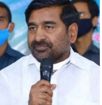
ఈటల రాజేందర్ పై

కాంగ్రెస్ తన 10 ఏండ్ల పాలనలో 88,500 ఎకరాల భూములు అమ్మారు. తెలంగాణలోని విలువైన భూములు అమ్మి అంద్రాలో ఖర్చు చేశారు. నాడు భట్టి విక్రమార్క ఒక్క మాట మాట్లాడలేదు. ఇప్పుడేమో కావాలని రాజకీయం చేస్తున్నారని మంత్రి అగ్రహం వ్యక్తం చేశారు. కేంద్రంలో బీజేపీ ప్రభుత్వం.. ప్రభుత్వ రంగ సంస్థలను అమ్ముడంతో పాటు 24 సంస్థల నుంచి 45 సార్లు వాటాలను విక్రయించింది. పెట్టుబడుల ఉపసంహరణ చేస్తే ప్రోత్సహకాలు, ప్రైవేటు ఇన్వెస్టుమెంట్ రాష్ట్రాలకు లేఖ రాసింది.. ఆ లేఖను విడుదల చేసేమని మంత్రి హరీష్ రావు పేర్కొన్నారు.