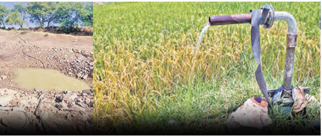
ఫిబ్రవరిలో 10.64 మీటర్లకు, మార్చిలో 12.16 మీటర్లకు పడిపోయాయి. జిల్లా వ్యాప్తంగా యాసంగిలో 4.50 లక్షల ఎకరాల్లో వివిధ రకాల వంటలు సాగు చేశారు. అత్యధికంగా 3.50 లక్షల ఎకరాల్లో వరి సాగింది. వరికి నీటి వినియోగం ఎక్కువ. 2.75 లక్షల ఎకరాల్లో బోర్ల కిందనే సాగు చేశారు. దీంతో భూగర్భ జలాలు భారీగా తగ్గిపోయాయి. ఈ ఏరియాల్లో ఎక్కువగా.. ఏప్రిల్

హైదరాబాద్: బోర్ల మీద ఆధారపడి వ్యవసాయం చేసే కామారెడ్డి జిల్లాలో భూగర్భ జలాలు క్రమంగా అడుగంటుతున్నాయి. జనపరి సుంచి ఏప్రిల్ నెలాఖరు వరకు సగటున 4.75 మీటర్ల లోతుకు నీటి మట్టాలు పడిపోయాయి. యాసంగి సాగులో భాగంగా రైతులు బోర్లతో నీటిని తోడేయడం, 15 రోజులుగా ఎండలు తీవ్రమవ్వడంతో నీళ్లు తగ్గిపోతున్నాయి. ప్రస్తుతం జిల్లాలో సగటున నీటి మట్టాలు 13.59 మీటర్ల లోతులో ఉంది. జనపరిలో 8.84 మీటర్ల లోతులో ఉండగా క్రమంగా తగ్గుతూ వచ్చాయి.