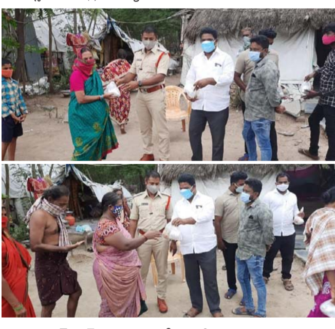
లాక్ డౌన్ సమయంలో నిరుపేదలకు మనవంతు