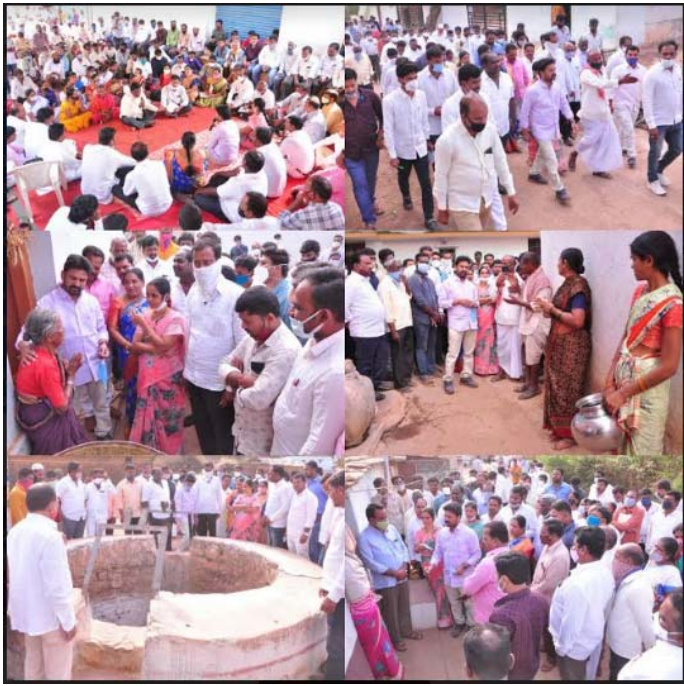
వికారాబాద్ జిల్లా ప్రతినిధి ఏప్రిల్ కార్యక్రమంలో భాగంగా గ్రామంలో 09 ప్రజా పాలన : పల్లె ప్రగతి పారిశుధ్యం పనులు వెంట వెంటనే