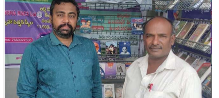
స్నేహ గ్రూపు ఎండ్ కటికల క్రాంతికుమార్