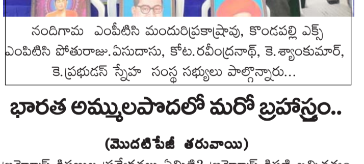
భారత అమ్మలపాదలో మరో బ్రహ్మాండం..

(మొదటిపేజీ తరువాయి) బ్రహ్మాండ క్షిణిలు ప్రత్యేకతలు ఏమిటి? బ్రహ్మాండ క్షిణి ఖచ్చితత్వం దానిని మరింత ప్రాణాంతకం చేస్తుంది. దీని వర్షం కూడా పెంచుకోవచ్చు. ఇది కాకుండా, ఈ క్షిణి శత్రు రాడార్ నుండి తప్పించుకోవడంలో కూడా ప్రవిణమైనది. బ్రహ్మాండ క్షిణిని రష్యా, భారత్ సంయుక్త ప్రాజెక్టుగా నిర్మించారు. ఇందులో బ్రహ్మాండ క్షిణి, మోస్ అంటే 'మోస్కో'. రష్యాలో ప్రవహించే నది పేరు మోస్కో. సూపర్ సోనిక్ క్రూయిజ్ క్షిణి అయిన బ్రహ్మాండ 21వ శతాబ్దపు అత్యంత ప్రమాదకరమైన క్షిణిలలో ఒకటిగా భావిస్తున్నారు. ఈ క్షిణి గంటకు 4300 కి.మీ వేగంతో శత్రు స్థానాలను ధ్వంసం చేయగలదు. ఇది 400 కి.మీ పరిధిలో శత్రువులను టార్గెట్ చేయగలదు. లక్ష్మణ్ బ్రహ్మాండ క్షిణి తయారీ యూనిట్ తాజాగా ఉత్తరప్రదేశ్ రాజధాని లక్నోలో బ్రహ్మాండ క్షిణి తయారీ యూనిట్ కు ప్రధాన సరేంద్ర మోడీ శంకుస్థాపన చేశారు. త్వరలో ఇక్కడ బ్రహ్మాండ క్షిణిలను తయారు చేయనున్నారు. బ్రహ్మాండ క్షిణి, ఇతర రక్షణ పరికరాలు, ఆయుధాలు తయారు చేస్తున్నామని, అందుకే ప్రపంచంలోని ఏ దేశంపైనా దాడి చేసేందుకు దీన్ని తయారు చేయడం లేదన్నారు. ప్రపంచంలో ఏ దేశం కూడా భారత్ ను చెద దృష్టితో చూసేందుకు సాహసించిన శక్తి కనిసం భారత్ కు ఉండాలంటే భారత్ గడ్డపై బ్రహ్మాండ నిర్మించాలనుకుంటోంది.