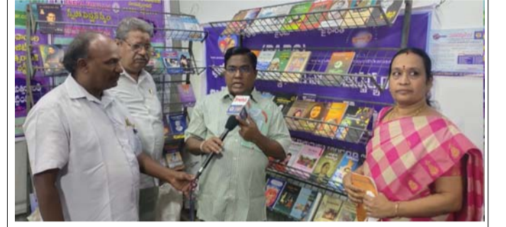
రాష్ట్ర ట్రిబల్ వెల్ఫేర్ డైరెక్టర్ వాడ్రేపు. చినవీరభద్రుడు ఐఎఎస్