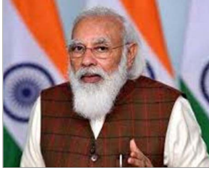
సురక్షితంగా ఉంచడానికి కష్టపడ్డ ఆరోగ్య కార్యకర్తలందరికీ 2020 సంవత్సరం అంకితం చేస్తున్నట్లుగా ప్రధాని మోడీ ప్రకటించారు.