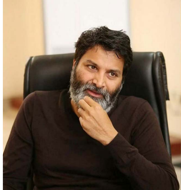
వచ్చాయి. రామ్ హీరోగా త్రివిక్రమ్ దర్శకత్వంలో సినిమా అడుగు ఇడుగు అంటూ వాయిదా పడుతూ వస్తోంది. గుంటూరు కారం సినిమాకు ముందు చర్చ జరిగింది. గుంటూరు కారం సినిమా తర్వాత రామ్ తో త్రివిక్రమ్ సినిమా ఉంటుందనే వార్తలు వచ్చాయి. ఇప్పుడు రామ్ తో కాకుండా

టాలీవుడ్ స్టార్ మ్యూజిక్ డైరెక్టర్ త్రివిక్రమ్ దర్శకత్వంలో ప్రస్తుతం గుంటూరు కారం సినిమా రూపొందుతోంది. ఆ సినిమా చిత్రీకరణ పూర్తి అవుతుందానే ఇటీవలే అల్లు అర్జున్ తో ఒక సినిమాను ప్రకటించిన విషయం తెల్సిందే. అల్లు అర్జున్ తో నాల్గవ సినిమాకు రెడీ అయిన త్రివిక్రమ్ చాలా ఏళ్ల క్రితం కమిట్ అయిన సినిమాను మాత్రం ఇప్పటి వరకు మొదలు పెట్టడం లేదు అంటూ కొందరు విమర్శిస్తున్నారు. త్రివిక్రమ్ కెరీర్ ఆరంభంలో స్రవంతి రవికిషోర్ బ్యానర్ లో మంచి ఆఫర్లు వచ్చాయి. ఆ ఆఫర్ల వల్లే త్రివిక్రమ్ తన ప్రతిభను చూపించుకున్న విషయం తెల్సిందే. అందుకే ఆ బ్యానర్ రుణం తీర్చుకోవాలి అనే ఉద్దేశ్యంతో ఆ ఫ్యామిలీకి చెందిన హీరో రామ్ తో ఒక సినిమాను చేసేందుకు త్రివిక్రమ్ ఆ మధ్య ఫ్లాన్ చేస్తున్నట్లుగా వార్తలు