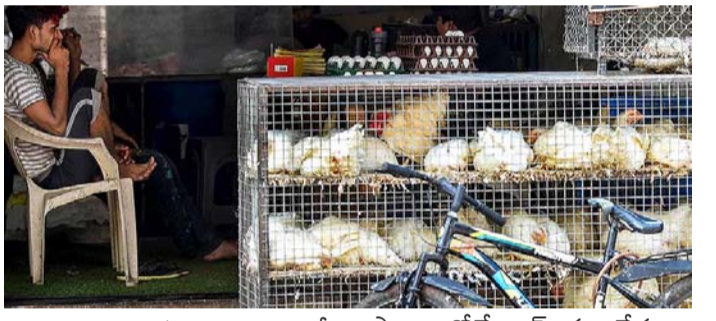
అంటున్నా కూడా ప్రజల్లో భయపడుతూ ఉండడంతో చిత్తే ధర మరింత తగ్గిపోయే అవకాశం ఉంది. విదేశాల నుంచి భారత్ వచ్చే వలస పక్షుల వల్ల బర్లె ప్లూ భారత్ దేశంలో మళ్లీ కనిపిస్తోందని కేంద్ర పశు ధిల్లీలో కిలో కోడి మాంసం ఖరీదు రూ.15కు పడిపోయింది. వాటి ధర ఒక్కసారిగా పదిపొవడంతో కోళ్ల వ్యాపారాలు ప్రతిరోజూ సుమారు కోటి 20 లక్షల రూపాయలు నష్టపోతున్నాయి. జింద్ జిల్లాలో పాల్లీ పరిశ్రమకు మంచి పేరుంది. ఆ జిల్లాలో 500కు మైగా పాల్లీ ఫారాలు, 80కి మైగా హ్యావరీలు ఉంటాయి. అక్కడి నుంచి ఢిల్లీకి విక్రయించే కోళ్ల బియ్యం నుమారు 8 లక్షల కిలోగ్రాములుంటుంది. చిత్తే ను బాగా ఉడికించి తినడం వల్ల నష్టమేమీ ఉండదని వైద్యులు