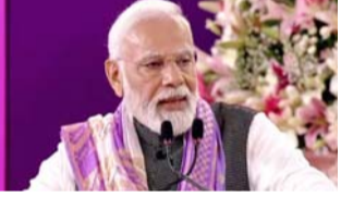
డాక్టర్లందరికీ నా ప్రత్యేక కృతజ్ఞతలు: మోడీ

న్యూఢిల్లీ: డాక్టర్ల దినోత్సవం (జూలై 1వ తేదీ) సందర్భంగా ప్రధాని మోడీ తన ట్వీట్ లో డాక్టర్లందరికీ ప్రత్యేక కృతజ్ఞతలు తెలిపారు. ఈ ట్వీట్ లో 'డాక్టర్స్ డే సందర్భంగా మొత్తం వైద్యుల సంఘానికి నా ప్రగాఢ కృతజ్ఞతలు. మహమ్మారి సమయంలో వైద్యులు ధైర్యానికి, నిస్వార్థతకు, స్థితిస్థాపకతకు ఉదాహరణగా నిలిచారు. వారి అంకిత బావం వైద్యం కంటే మించినది. ఇది సమాజానికి ఆశ, బలాన్ని ఇస్తుంది' అని పేర్కొన్నారు. కాగా, ప్రముఖ వైద్యుడు, విద్యావేత్త, స్వాతంత్ర్య సమరయోధుడు, రాజకీయ నాయకుడు అయిన డాక్టర్ బిధాన్ చంద్రారావు జయంతి సందర్భంగా డాక్టర్ల దినోత్సవాన్ని దేశవ్యాప్తంగా జరుపుకుంటారు.