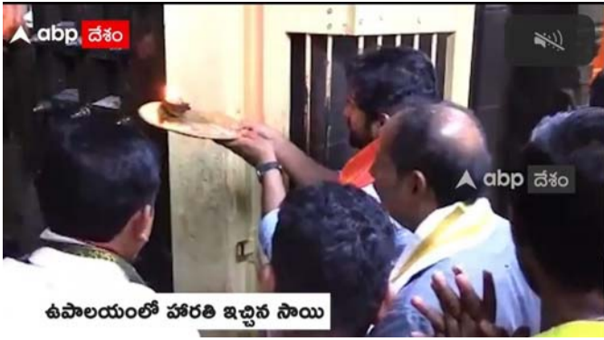
ఉపాలయంలో హారతి ఇచ్చిన సాయి

హైదరాబాద్ (ప్రజాపాలన ప్రతినీధి): దేవునికి భక్తునికి మధ్యలో ఈ పూజారులు, పాస్తర్లు, మౌలావీలు వీళ్ళందరూ అవసరమా అనే దృక్పథంతో సూతన సాంప్రదాయానికి సాయిధర్మతేజ్ తెరలేపారా అని ప్రజలందరూ చర్చించుకుంటున్నారు. కొన్ని రోజుల క్రితం శ్రీకాళహస్తి ఆలయాన్ని సందర్శించిన సినిమా హీరో సాయి ధర్మ తేజ్ సుబ్రహ్మణ్య స్వామి వారికి స్వయంగా హారతి ఇవ్వడం చర్చనీయాంశంగా మారింది. ఆలయం లో పూజారులు హారతి ఇవ్వడం ఆచారంగా ఇప్పటి వరకు కొనసాగుతుండగా, దేవుడికి భక్తుడికి మధ్య అనుసంధానంగా ఎవరి అవసరం లేదని, అన్ని మతాలలో ఇలాగే మధ్యవర్తుల లాంటి వారి అవసరం లేకుండా మనమే స్వయంగా ధూప దీప నైవేద్యాలు సమర్పించుకుంటే భక్తి, ముక్తి దొరుకుతుందన్నది సాయి ధర్మ తేజ్ చర్చల ద్వారా ప్రస్తుతమయ్యాయని పలువురు చర్చించుకుంటున్నారు. సాయిధర్మ తేజ్ చేసిన చర్య వట్ల ప్రజలందరూ స్వాగతస్తున్నారు. భగవంతునికి, భక్తునికి మధ్య అనుసంధానంగా ఎవరు ఉండకుండా అన్ని మతాల వారు దీన్ని ఆదర్శంగా తీసుకొంటే భావుంటుందని పలువురు భావిస్తున్నారు.