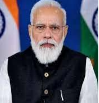
పునీత్ చనిపోయే వయస్సు కాదు..

ధరణి భూ సంబంధిత లావాదేవీలకు ధరణి వన్ % -- % స్టాప్ వ రిష్యూరాన్ని అందిస్తుంది. ధరణి ప్రారంభంతో రిజిస్ట్రేషన్ సేవలు ప్రజల ఇంటి వద్దకే చేరాయి. ధరణికి ముందు 141 నబీ రిజిస్ట్రార్ కార్యాలయాల్లో రిజిస్ట్రేషన్లు జరిగేవి. ఇప్పుడు రాష్ట్ర వ్యాప్తంగా ప్రతి మండలంలో 574 తహశీల్దార్ కార్యాలయాల్లో రిజిస్ట్రేషన్లు జరుగుతున్నాయి. భూపరిపాలనలో ధరణి కొత్త ప్రమాణాలను నెలకొల్పింది. మొదటి సంవత్సరంలోనే ధరణి సాధించిన ప్రగతి అంతా ఇంతా కాదు. ఈ ఏడాదిలో ధరణి వెబ్ పోర్టల్ 5.17 కోట్ల హిట్లను సాధించగా, ధరణి ద్వారా దాదాపు 10 లక్షల లావాదేవీలు పూర్తయ్యాయి. ఇంతకు ముందు వట్లాదార్ పాసుపుస్తకాలు ఇవ్వని దాదాపు 1,80,000 ఎకరాల భూమిని ఈ ఏడాది కాలంలో ధరణి పరిధిలోకి తీసుకొచ్చారు. నిత్యం పెరుగుతున్న మార్పులు, (మిగతా 5లో..)