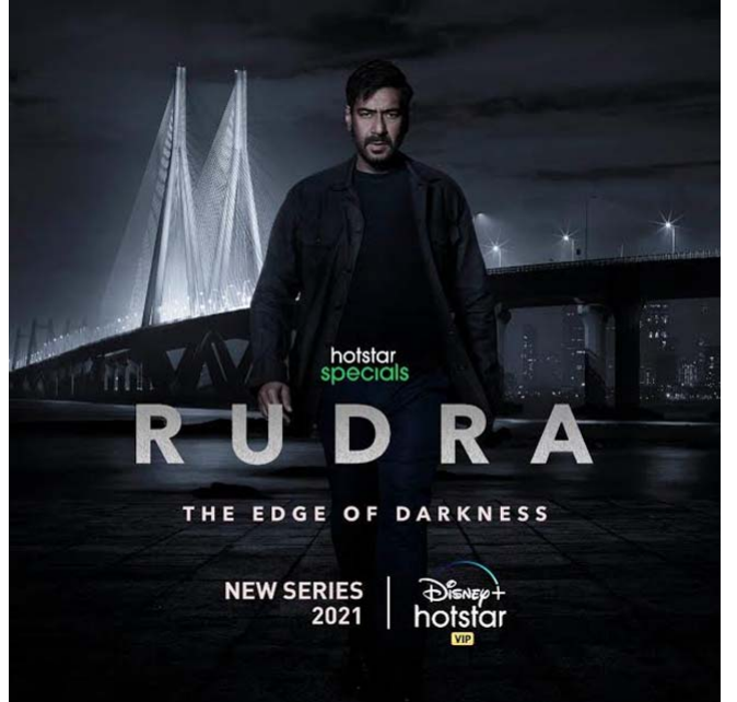
రాబోయే రోజుల్లో వెబ్ కంటెంట్ మావా కొనసాగుతుందని భావించిన స్టార్ హీరోహీరోయిన్లు డిజిటల్ వరల్డ్ లో అడుగులు వేస్తున్నారు.