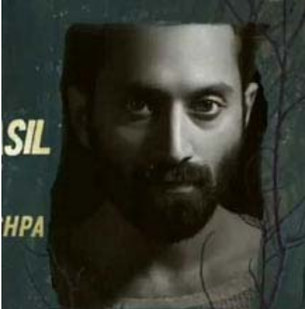
ఫహద్ ఫాసీల్ ఈ చిత్రానికి తన ఛాట్ నిమిత్తం సెట్స్ లో అడుగు పెట్టినట్లు తెలుస్తుంది.

స్టైలిష్ స్టార్ అల్లు అర్జున్ హీరోగా రష్మికా మధ్య హీరోయిన్ గా ఇంటెలిజెంట్ దర్శకుడు సుకుమార్ తెరకెక్కిస్తున్న భారీ బడ్జెట్ పాన్ ఇండియన్ చిత్రం "పుష్ప". లేటెస్ట్ గా వచ్చిన టీజర్ తో భారీ రెస్పాన్స్ ను కొల్లగొట్టిన ఈ చిత్రం ఇప్పుడు శరవేగంగా జరుపుకుంటుంది. మరి ఇదిలా ఉండగా ఈ చిత్రానికి సంబంధించి లేటెస్ట్ అప్డేట్ ఒకటి వినిపిస్తుంది. ఈ మధ్యనే ఈ చిత్రంలో విలన్ రోల్ కు తీసుకున్న విలక్షణ నటుడు ఫహద్ ఫాసీల్ ఈ చిత్రానికి తన ఛాట్ నిమిత్తం సెట్స్ లో అడుగు పెట్టినట్లు తెలుస్తుంది. మళయాళంలో తన సినిమాలతో మన దగ్గర కూడా మంచి గుర్తింపు తెచ్చుకున్నా ఈ నటుడు ఈ సినిమాలో బన్నీకి విలన్ గా చేస్తున్నాడన్న వార్త రావడంతో ఈ కాంటోపై మరిన్ని అంచనాలు సెట్టయ్యాయి. మరి ఆన్ స్క్రీన్ పై వీరి బ్యాటిల్ ఎలా ఉంటుందో చూడాలి. ఇక ఈ భారీ చిత్రానికి దేవిత్రీ ప్రసాద్ సంగీతం అందిస్తుండగా మైత్రి మూవీ మేకర్స్ నిర్మాణం వహిస్తున్న సంగతి తెలిసిందే.