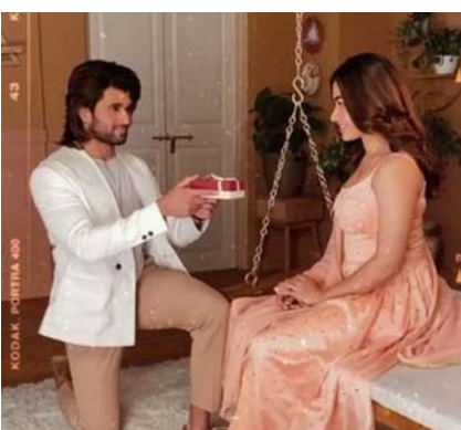
విజయ్ దేవరకొండ - రష్మిక కలిసి నటించినట్లు తెలుస్తోంది.

టాలీవుడ్ లో సెన్సేషనల్ స్టార్ విజయ్ దేవరకొండ - లక్ష్మి బ్యూటీ రష్మిక మధ్య జోడికి ఉండే క్రేజ్ గురించి ప్రత్యేకంగా చెప్పాల్సిన అవసరం లేదు. 'గీతగోవిందం' సినిమాలో 'ఇంకేం ఇంకేం ఇంకేం కావాలే' అంటూ ఆన్ స్క్రీన్ రొమాన్స్ పండించిన ఈ జంట.. 'దియర్ కామ్రేడ్' మూవీతో మరోసారి జతకట్టారు. సిల్వర్ స్క్రీన్ పై మంచి జోడీ అనిపించుకున్న వీరిద్దరూ రియల్ లైఫ్ లో రిలేషన్ షిప్ లో ఉన్నారని అప్పట్లో పుకార్లు ఓ రేంజ్ లో పుట్టుకొచ్చాయి. హీరో రష్మిక తల్లితో రష్మిక ఎంగేజ్మెంట్ క్యాన్సిల్ అవడానికి కారణం ఇదేనని గుసగుసలు వినిపించాయి. కానీ ఇవేమీ బట్టించుకోని ఈ క్రేజ్ జంట.. ఎవరి పనుల్లో వాళ్ళు బిజీ అయ్యారు. అయితే ఇప్పుడు మరోసారి విజయ్ - రష్మిక కలిసి నటించినట్లు తెలుస్తోంది. కాకపోతే అది ఏ సినిమా కోసమో అనుకుంటే పొరపాటే. వీరిద్దరూ కలిసి నటించింది ఓ కమర్షియల్ యాడ్ కోసం. సంతూర్ ప్రొడక్షన్స్ కొత్త బ్రాండ్ అంబాసిడర్స్ గా విజయ్ దేవరకొండ - రష్మిక మధ్య ఒప్పందం కుదుర్చుకున్నారు. ఇందులో భాగంగా వీరిద్దరితో ఇటీవల యాడ్ షూటింగ్ చేసినట్లు తెలుస్తోంది. విజయ్ మోకాళ్ళపై కూర్చొని రష్మికకు ఓ గిట్టి అందిస్తున్నట్లు ఈ యాడ్ లో కనిపిస్తున్నారు. వెండితెరపై ఫర్వాలేదు పెయిర్ అనిపించుకున్న విజయ్ - రష్మిక సంతూర్ యాడ్ తో మరోసారి అలరించబోతున్నారు. ఇకపోతే వీరిద్దరూ ఇప్పుడు బాలీవుడ్ లో సత్తా చాటే ప్రయత్నాల్లో ఉన్నారు. విజయ్ 'లైగర్' అనే పాన్ ఇండియా సినిమా చేస్తుంటే.. 'మిషన్ మజ్ను' సినిమాతో రష్మిక బాలీవుడ్ లో అడుగుపెడుతోంది. రెండు సినిమాల షూటింగ్ ముందై లోనే జరుగుతుండటంతో ఇద్దరూ వీలైనప్పుడల్లా కలుస్తున్నారని తెలుస్తోంది.