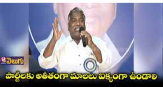
పార్టీలకు అతీతంగా మాలల బక్సీని ఉండాలి