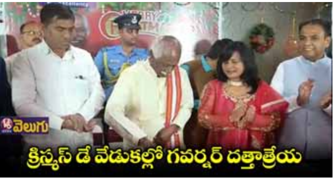
క్రీస్తున్ దే వేడుకల్లో గవర్నర్ దత్తాత్రేయ

హైదరాబాద్ (ప్రజాపాలన ప్రతినిధి): బంజారాహిల్స్ లోని ఇండ్రోల్ అపార్ట్ మెంట్ లో క్రీస్తున్ దే వేడుకలు ఘనంగా జరిగాయి. ఇందులో హర్యానా గవర్నర్ బందారు దత్తాత్రేయ పాల్గొన్నారు. క్రీస్తు పుట్టిన రోజును ప్రపంచవ్యాప్తంగా ఘనంగా జరుపుకుంటున్నారని, ఇదే రోజు మరో మహనీయుడు అటల్ బిహారీ వాజ్ పేయ్ జయంతి జరుపుకోవడం సంతోషకరం అన్నారు. ప్రేమ, కరుణ, ధర్మ, సౌభ్రాతృత్వం, మానవత్వం విలువలతో ప్రపంచానికి సందేశం ఇచ్చారన్నారు. అవే విలువలతో వాజ్ పేయ్ ప్రధానిగా పరిపాలన సాగించారన్నారు.