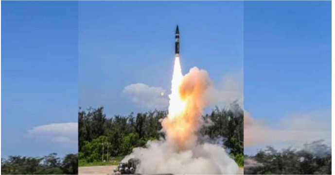
భువనేశ్వర్, జూన్ 28, ప్రజాపాలన ప్రతినిధి: అణ్వాయుధ సామర్థ్యం

వైద్య రంగానికి రూ.50 వేల కోట్లు దిల్లీ, జూన్ 28, ప్రజాపాలన ప్రతినిధి: కోవిడ్-19 రెండో దశలో కుంగిన భారత ఆర్థిక వ్యవస్థకు ఊపిరిలూడేందుకు కేంద్ర ప్రభుత్వం మరొకటి ఉద్దేశనలు ప్రకటించింది. ఈ మేరకు కేంద్ర ఆర్థిక మంత్రి నిర్మలా సీతారామన్, సహాయ మంత్రి అనురాగ్ ఠాకూర్ సోమవారం నిర్వహించిన విలేకరుల సమావేశంలో ప్రభుత్వం తీసుకున్న పలు కీలక నిర్ణయాలను ప్రకటించారు. ముఖ్యంగా వైద్య వనతులను మెరుగుపరచడంపై ప్రత్యేక దృష్టి సారించారు. కేంద్ర తీసుకున్న కీలక నిర్ణయాలు... బెర్ 2, 3 పట్టణాల్లో వైద్యసౌకర్యాల కల్పన విస్తరణ ఉత్తరప్రదేశ్ లో వైద్య సౌకర్యాల కల్పనపై ప్రత్యేక దృష్టి (మిగతా 2లో..)